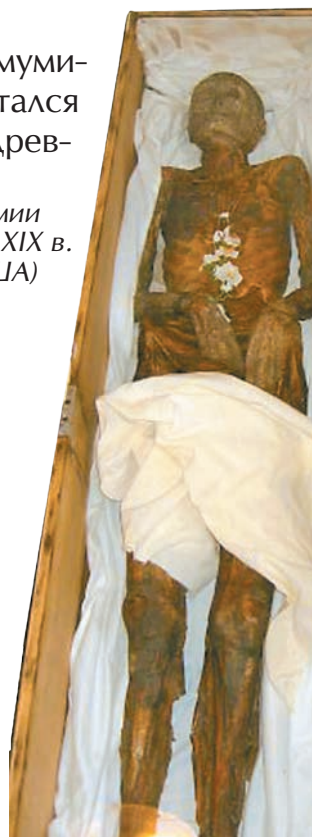
Мумии конца XIX в. (США)