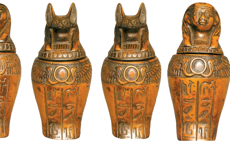
Ритуальные сосуды – канопы