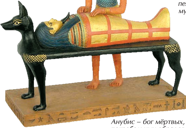
Льняная пелена мумии