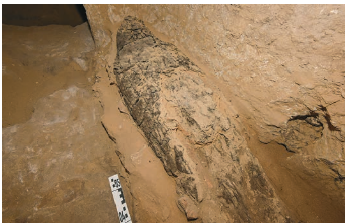
Одна из двух мумий в погребальной камере шахты 4 гробницы Каемнофрета (LG 63)