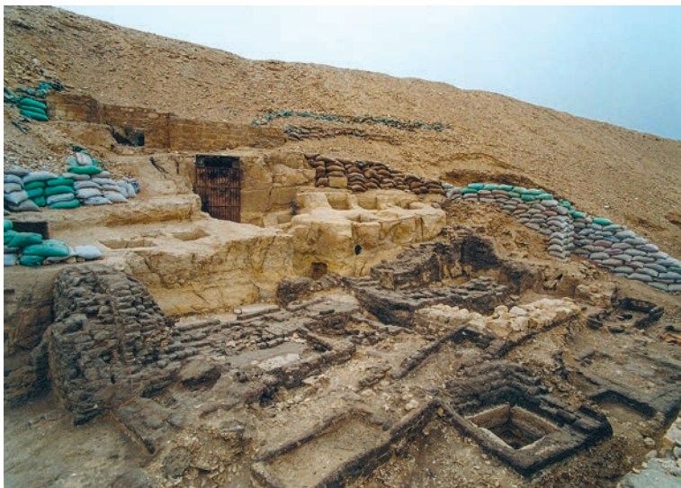
Малый некрополь перед скальной гробницей Хафраанха, полевой сезон 2002 года