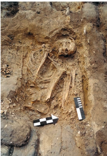
Погребения № 50, 53 и 36 в Малом некрополе перед гробницей Хафраанха, поздняя V–VI династии