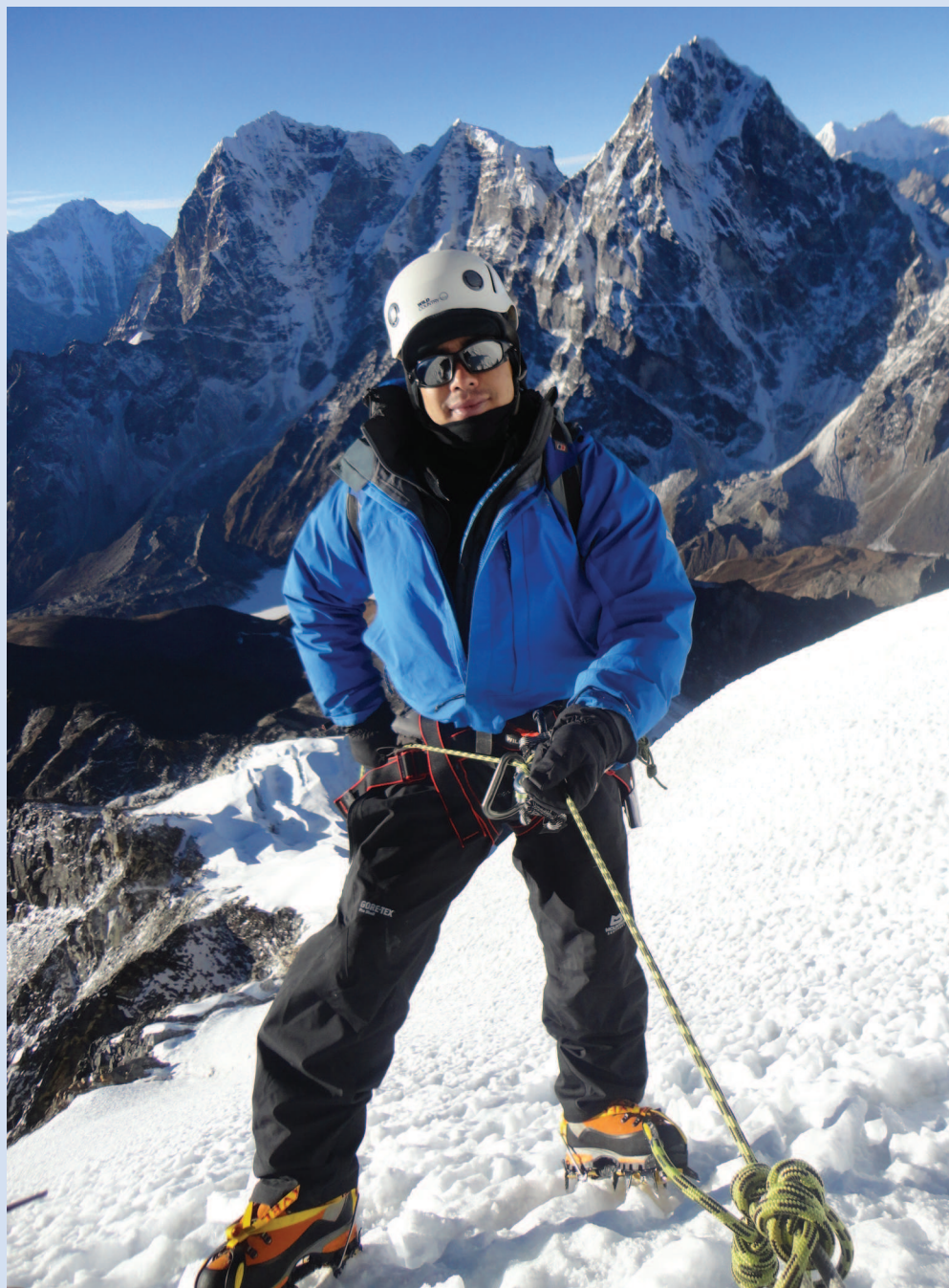
Первое серьезное восхождение. Пик Лобуче. Привыкаю ходить в кошках