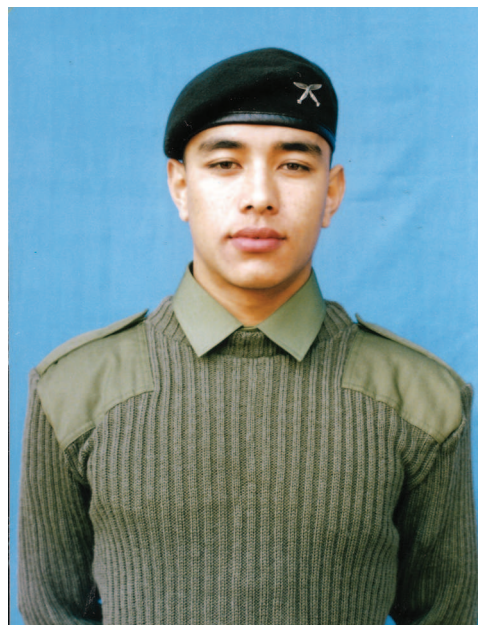
Все нормативы сданы успешно. Я готов стать гуркхом