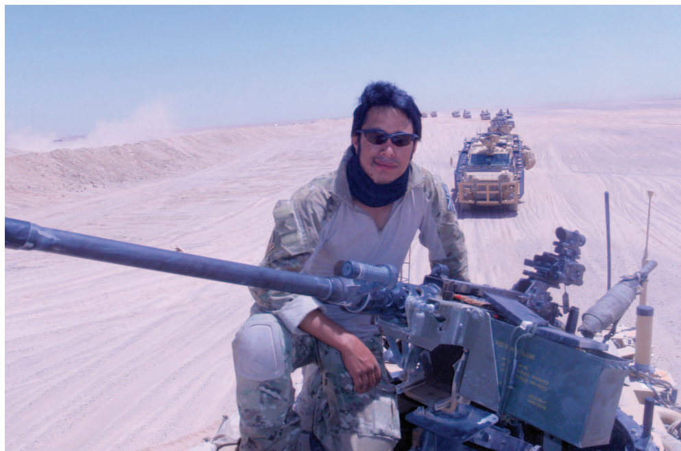
Нелегкая служба в пустыне, но мне нравилось

поэтому обойдусь лишь краткой историей. Англичане имели возможность оценить боевые качества гуркхов во время англо-непальской войны 1814–1816 годов, когда непальская армия противостояла армии Британской Ост-Индской компании (численность последней вдвое превышала численность регулярной английской армии). И британцы были настолько впечатлены, что заключили с Королевством Непал договор, позволявший нанимать гуркхов и формировать из них нерегулярные вооруженные силы.