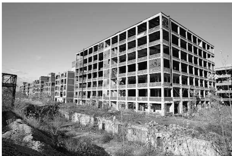
Автомобильный завод Packard. Некогда он был визитной карточкой Детройта