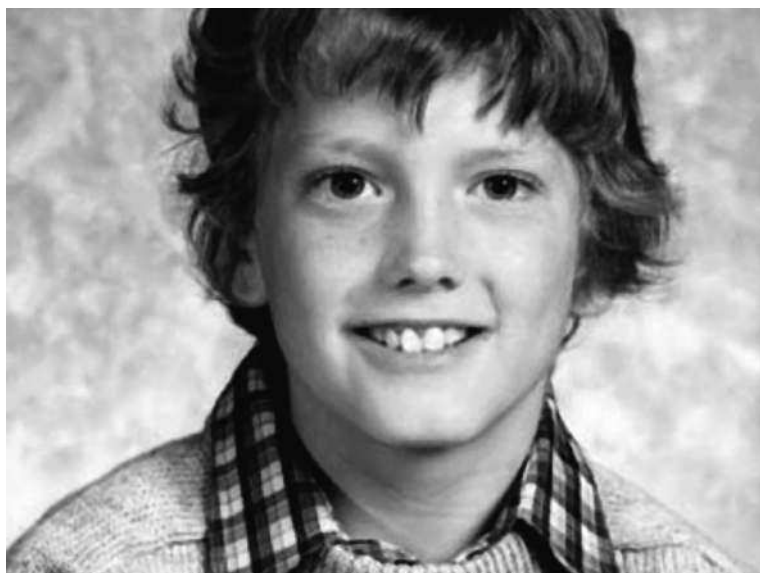
Еминем в детстве