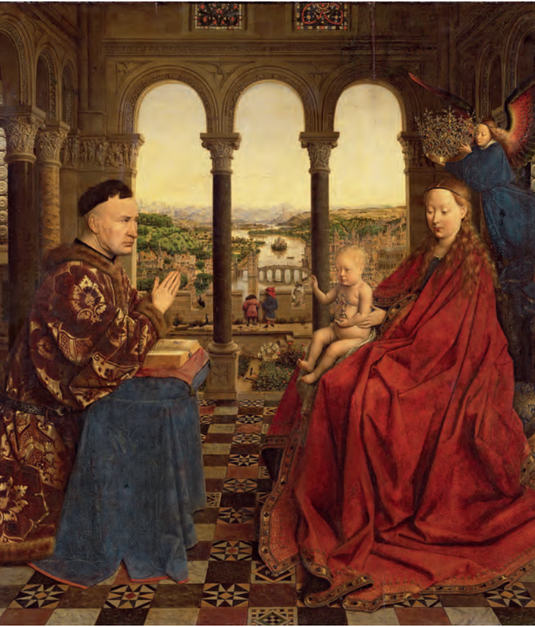
Наверху: Ян ван Эйк. Мадонна канцлера Ролена. 1435. Ван Эйк в реалистичной манере написал маслом Мадонну, канцлера и убедительный пейзаж на заднем плане