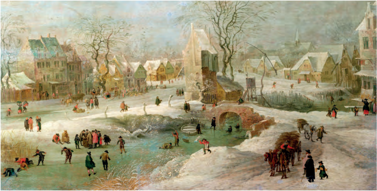
Сверху: Ян Брейгель Старший. Голландия зимой. Около 1600. Младший сын Брейгеля передал типичный городской зимний пейзаж, хотя в живописи он более изобретательный и творческий, чем его старший брат, Питер Младший

в 1568 г. Вазари лично знал некоторых мастеров, о которых писал. Он считается основоположником современного искусствознания. Вазари слышал о Брейгеле Старшем и называл его вторым Босхом.