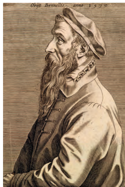
Сверху: Доминик Лампсоний. Питер Брейгель Старший. Гравюра. 1572. На этом посмертном изображении художник показан серьезную и даже величественную

На некоторых наиболее известных работах художника изображены крестьяне, поэтому живописца иногда называют Брейгелем Крестьянским. Некоторые специалисты считают, что