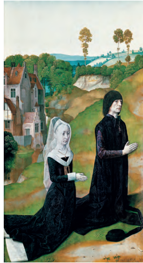
Сверху: Гуго ван дер Гус. Святой Ипполит. Триптих. Около 1468 (фрагмент). Гуго ван дер Гус был выдающимся нидерландским художником XV в., а эта работа считается одним из лучших его произведений

а некоторые провинции старались выйти из состава герцогства. Чтобы вернуть контроль над землями, Мария вышла замуж за будущего императора Священной Римской империи Максимилиана Габсбурга. С тех пор судьба Нидерландов была связана с династией Габсбургов.