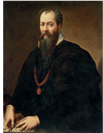
Сверху: Джорджо Вазари. Автопортрет. 1566—1568. Автор «Жизнеописаний» называл Брейгеля вторым Босхом

Итальянец Людовико Гвиччардини жил в Антверпене и был знаком