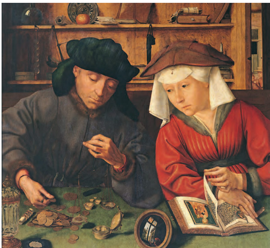
Сверху: Квентин Массейс. Меняла с женой. Около 1514. Прекрасная работа одного из предшественников Брейгеля Старшего, на которой художник с юмором, в реалистичной манере изобразил менялу с женой

наиболее выдающихся работ считается «Мадонна канцлера Ролена» (см. стр. 17), созданная в 1435 г. Пышно одетые канцлер и Мадонна на переднем плане внушительны, но взгляд зрителя скользит мимо сияющего интерьера, через арки — к далекому пейзажу речной долины, выполненному с мастерством отображения света и пространства.