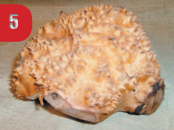
«Вот он ежик». Заготовка из капа

Почему начал резать из сувелей и капов? Да просто пошел как-то на вернисаж в Измайлово полюбопытствовать и увидел там интересные плосочки и вазы из красивейшего материала. Думал, карельская береза, а оказалось — обычный березовый кап. Решил попробовать поработать и с ним. Получилось. Понравилось. Начал экспериментиро-