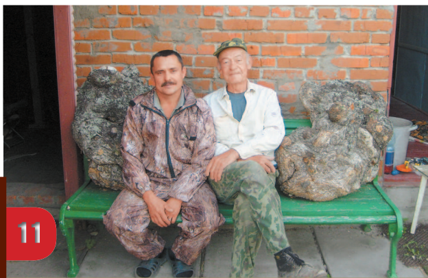
Новые «презенты» от лесника