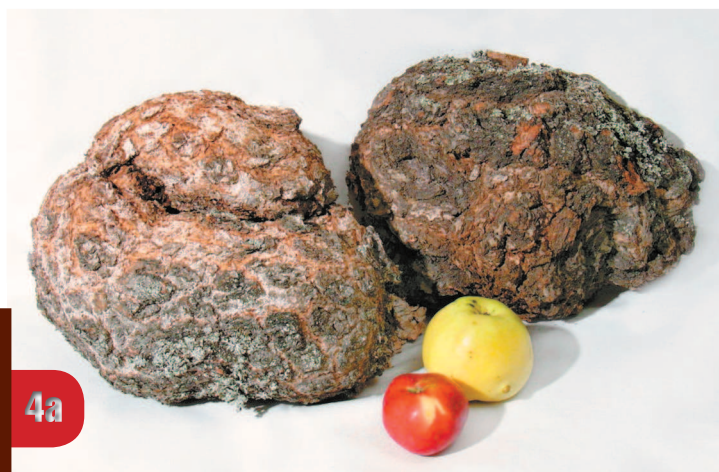
Наросты с корой: а — свежесрезанный березовый сувель; б — пробуждение каповых позек

— с помощью бормашины; приходится пользоваться и самостоятельно изготовленными инструментами. Это различные шарошки на пробках, грибки из наждачной бумаги, шлифовальные приспособления на основе саморезов, инструменты на коже и ковролине и др. Получается под свою руку и дешево.