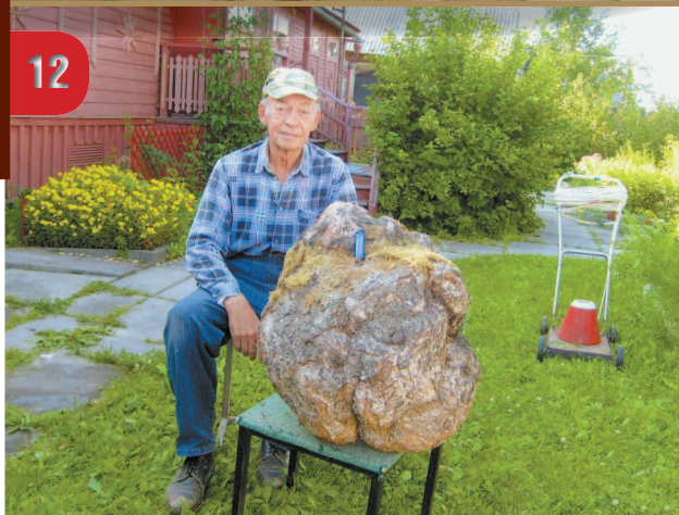
Сувель из отходов лесопилки