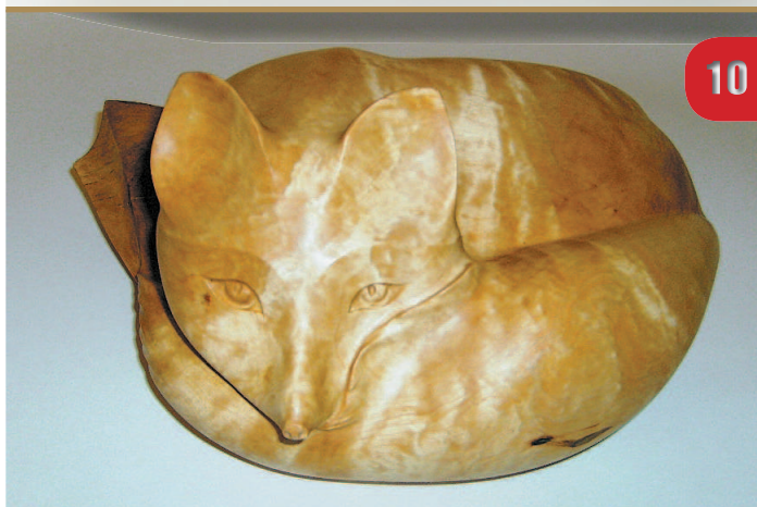
Трельяжница «Муаровое свечение». Березовый сувель