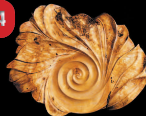
Настенное панно «Спираль жизни»