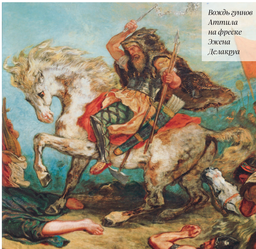
Вождь гуннов Аттила на фреске Эжена Делакруа

■ 50 ДЕНАРИЕВ ГУНТАМУНДА (кон. V в.) — одна из старейших сохранившихся варварских монет. Правитель вандалов Гунтамунд подражал римским образцам. И на монете скорее не варварский, а римский (византийский) правитель. «Варварские денарии» стали основой для других монет формирующихся государств Европы