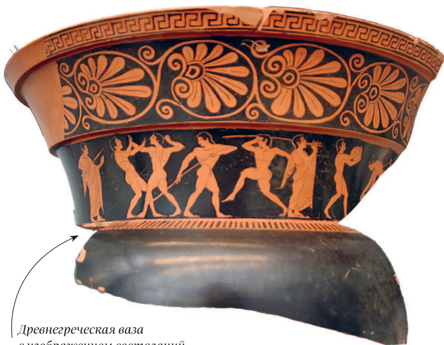
Древнегреческая ваза с изображением состязаний

■ У ГРЕКОВ — СВОИ ТОНКОСТИ. В Греции времен Гомера использовали маловесные таланты, при помощи которых отмеряли в основном золото — весом около 16 современных граммов