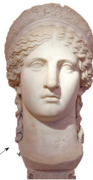
Юнона (у греков она именовалась Герой), покровительница семьи, брака и деторождения. Скульптура I в. н. э. из Национального музея Рима

■ БОГИНЯ АФИНА. Она почиталась как богиня мудрости и справедливой войны — а мудрость и справедливость очень важны в финансовых вопросах