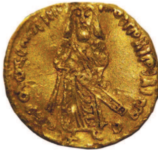
Портрет правителя на монете — предельно обобщенный

первым изготовил собственные монеты — неизвестно. К числу старейших дошедших до нас относятся динары халифа Абд аль-Малика (VII — нач. VIII в.). На аверсе изображался правитель, но потом, согласно требованиям ислама, портрет с монет убрали