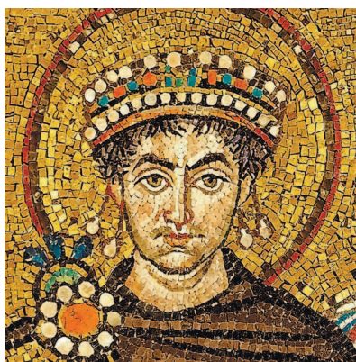
Изображение одного из самых известных византийских правителей — Юстиниана I — на мозаике храма Сан-Витале в Равенне

самая известная золотая монета Рима. Он появился еще в III веке до нашей эры и первоначально, судя по всему, использовался для награждений. Вес ауреуса менялся с течением времени, но обычно составлял \frac{1}{40} либры