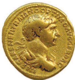
Ауреус императора Траяна (I–II века н. э.)

Многие названия номиналов и денежных единиц, известные и популярные в XX–XXI веках, появились не сегодня и не вчера. Шиллинги, лиры, фунты, динары — родословная этих названий начиналась в глубокой древности. Причем изначально это были вовсе не монеты, а уже известные вам весовые единицы — понятия, обозначающие определенное количество того или иного металла... Или, например, муки либо зерна. С происхождением некоторых названий вы уже знакомы. Рассмотрим еще несколько интересных примеров.