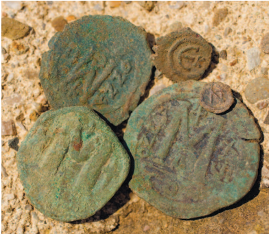
Именно от византийского «нуммий» или от латинского «номизма» (монета) произошло слово «нумизматика»

МОНЕТЫ первых веков нашей эры. Буква «М» в данном случае обозначает номинал: 1 фоллис, или 40 нуммиев. Первоначально медные фоллисы весили 10–13 граммов, впоследствии они стали меньше и легче