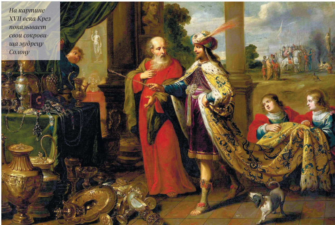
На картине XVII века Крез показывает свои сокровища мудрецу Солону

■ «БОГАТ, КАК КРЕЗ». Лидийский правитель Крез однажды выпустил статеры из чистого золота 990-й пробы весом 11 граммов. Сейчас такие статеры чрезвычайно редки. А имя Креза стало нарицательным, превратившись в символ невероятного богатства и роскоши