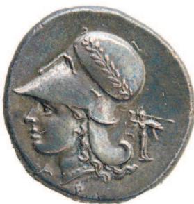
Позднее из подобных изображений рождаются также гербы государств

Считается, что прозвище «Юнона-Монета» появилось после того, как во времена войн Рима с эпирским царем Пирром она предсказала римлянам победу — в случае, если они будут вести войну справедливо