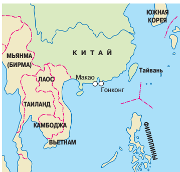
Старинный трамвай на острове Гонконг

Преодолеть экономическую пропасть, разделяющую Гонконг и континентальный Китай, вряд ли возможно. Экономика Гонконга процветает за счет поставок на международный рынок огромного количества китайских товаров, которые производятся внутри КНР зачастую под гонконгским руководством. По принципу «Одна страна – две системы» Гонконг стал Специальным Административным Регионом Народной Республики Китай 1 июля 1997 г. Это обеспечивает высокий уровень автономии, включая сохранение капиталистической системы