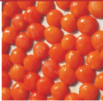
Экзотика: соленые яйца

Английский ритуал чаепития в пять часов сохранился в Гонконге и сегодня.