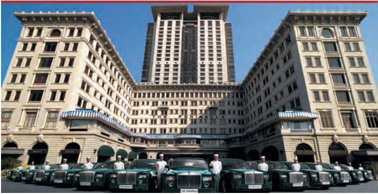
Знаменитый отель «Пенинсула»

4546, www.hongkong-ic.intercontinental.com . Один из старейших отелей города; находится в прекрасном