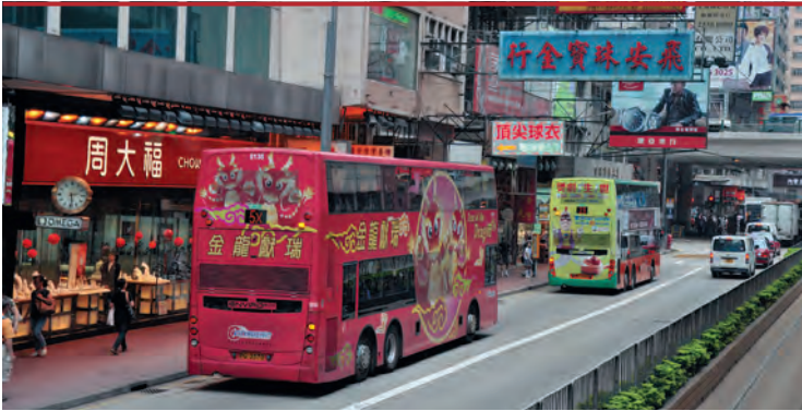
На городских улицах

На пути удобно сделать пересадку и добраться до Восточных Новых территорий. Электрички западного направления (West-Rail) обеспечивают общение между Нам-Чёнг (Nam Cheong), что на северо-западе Коулуна, и Тюн-Мун (Tuen Mun).