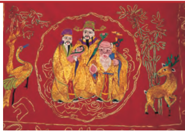
Даосские святые и символы счастья

Столь долгое господство конфуцианской идеологии в странах Восточной Азии естественно наложило свой отпечаток. Социальная закоренелость общества, авторитарные режимы, сфабрикованные выборы, ущемление в правах женщин, распределение постов по старшинству, а не по заслугам — все это неприятные последствия конфуцианства. И Гонконг не исключение, хотя высокое участие иностранного капитала и веяние новых западных идей в бизнесе (принцип сдельной оплаты, акционерные и руководящие