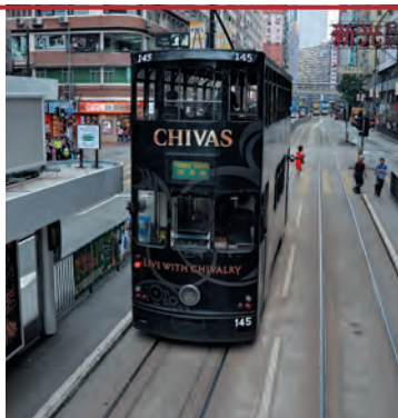
Двухэтажный трамвай на о. Гонконг

Метро ( MTR, Mass Transit Railway ) – самый быстрый вид городского транспорта насчитывает