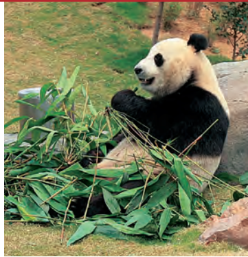
Панда в Оушен парке

Животный мир представлен прежде всего насекомыми. Блестящие жучки и ослепительно красивые бабочки становятся во время каждой прогулки вашими верными