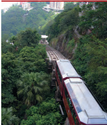
На фуникулере (многие называют его трамваем) можно добраться на пик Виктория

Южной Кореей и Тайванем. Гонконгская фондовая биржа — седьмая по величине в мире. В 2006 г. она уступала лишь Лондонской. Согласно Индексу финансовых центров мира, составляемому Корпорацией лондонского Сити с целью оценки конкурентноспособности 46 финансовых центров по всему миру, Гонконг является третьим финансовым центром в мире и первым в Азии.