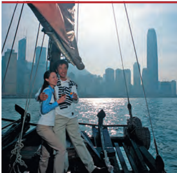
Прогулка на традиционной джонке с алыми парусами

сидеть на улице с бокалом пива, вина или с коктейлем, а также незамысловатой закуской. Излюбленное место встречи художников.