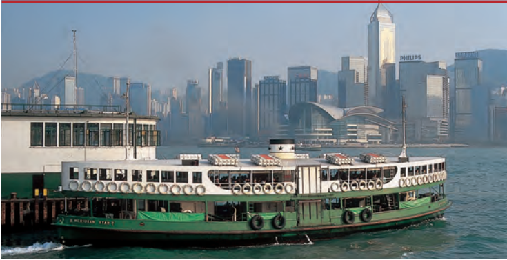
Знаменитый паром Star Ferry

димых товаров постепенно повышались: преобладали бытовая техника и игрушки, детали для оптических и электронных приборов, часы и украшения. Сегодня речь уже идет не только о сборке изделий, разработанных за рубежом, но и об изобретении новых.