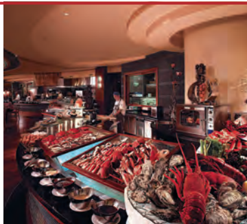
Традиционный шведский стол в отеле

му в северной кухне рис заменяют приготовленные на пару булочки и лапша. Фирменным блюдом этого региона признаны пельмени «цзяо-цзы». Конечно же, в Гонконге можно отведать и пекинскую утку. Рецепт ее придумали в Пекине: утку обмазывают специальным маринадом, после чего жарят при очень высокой температуре.