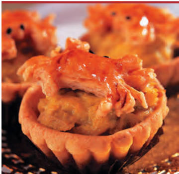
Оригинально оформленные закуски