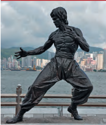
Статуя Брюса Ли на Аллее Звезд

надлежит обращать к равнине или к водной поверхности. Это легко объясняется: идеи фэн-шуй пришли из Северного Китая, где веют ледяные ветры и песчаные бури из монгольских пустынь устремляются на север. В таком случае гора за спиной является надежным защитником. С южной стороны, напротив, она закрывает солнце, дающее жизнь так же, как и вода.