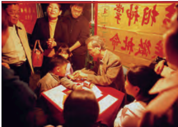
Гонконгцы охотно обращаются к предсказателям