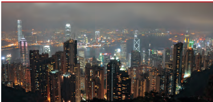
Залив Виктория и полуостров Коулун с вершины пика Виктория