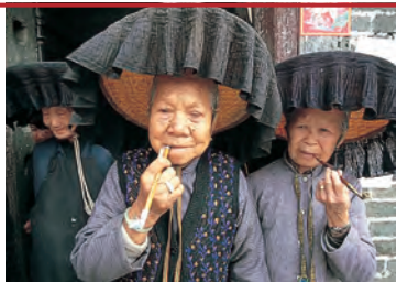
Женщин хакка легко узнать по их широкополым шляпам

В 1980-х гг. подобные рестораны начали появляться в чайнатаунах Австралии, Канады, Великобритании и США. Клиенты заказывают еду на входе и забирают через несколько минут у специального прилавка. По качеству блюда не отличаются от ресторанных.