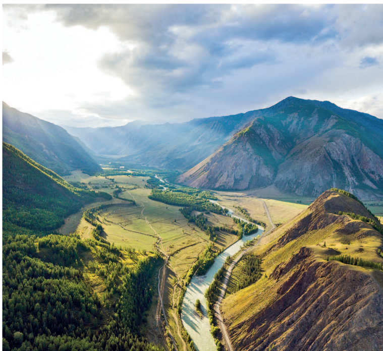
Долина реки Чуя

Дорога, отходящая от него на восток, приведет вас к глубоко-