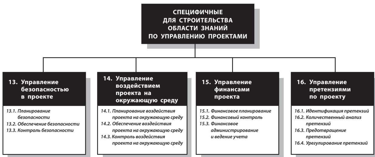
Рисунок 1.2 Обзор областей знаний по управлению проектами и процессов управления, специфичных для строительных проектов