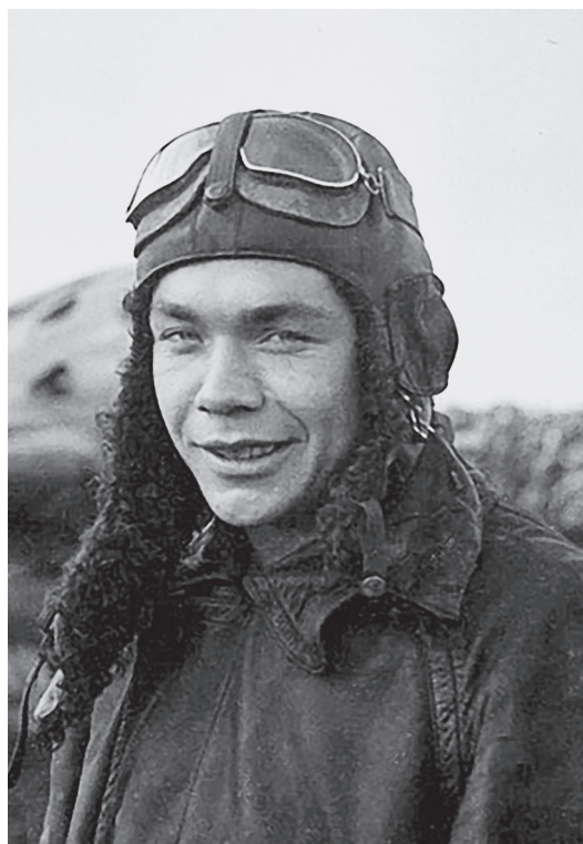
Ф.Ф. Герасимов Сайт «Дорога памяти»