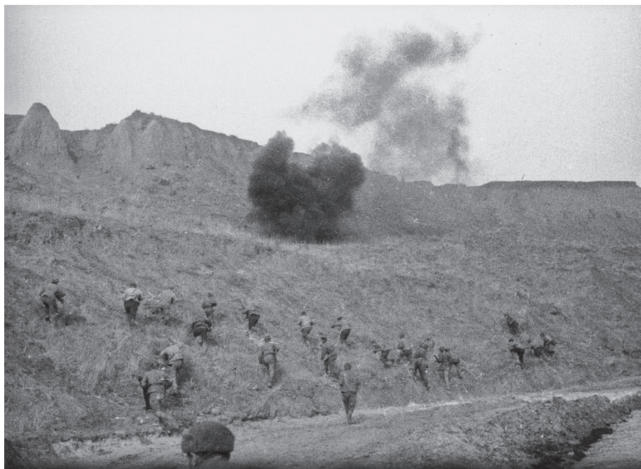
Штурм Сапун-горы советскими войсками. 7 мая 1944 г.