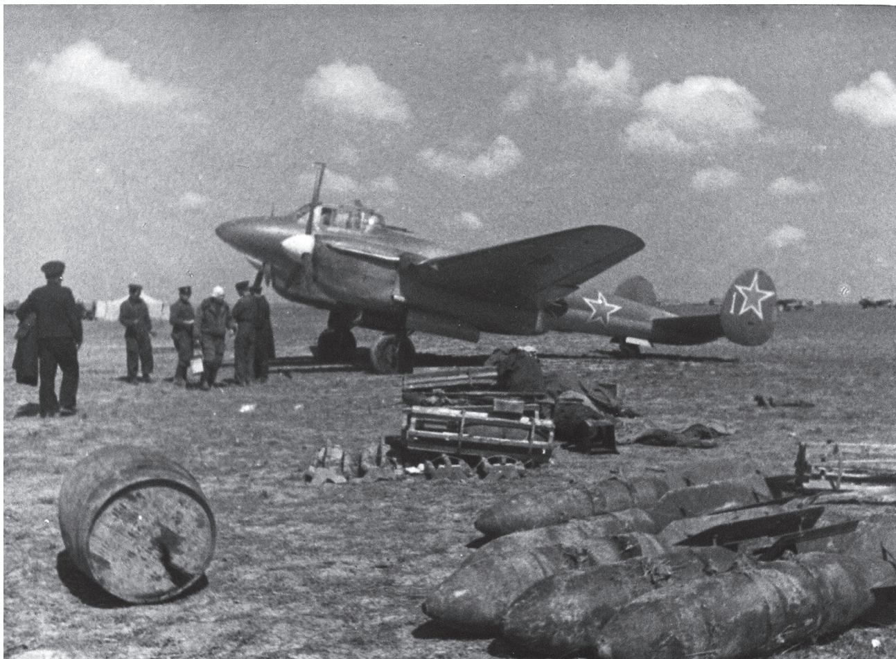
Бомбардировщик Пе-2 авиации Черноморского флота. Конец апреля — начало мая 1944 г.