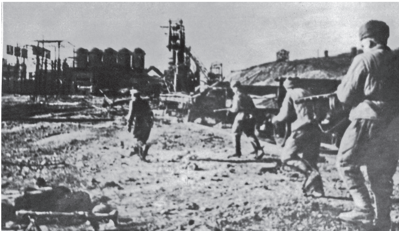
Бой на заводе им. Войкова в Керчи. Апрель 1944 г.