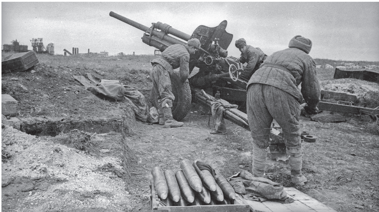
Артиллерийский расчет дивизионной артиллерии ведет огонь под Керчью