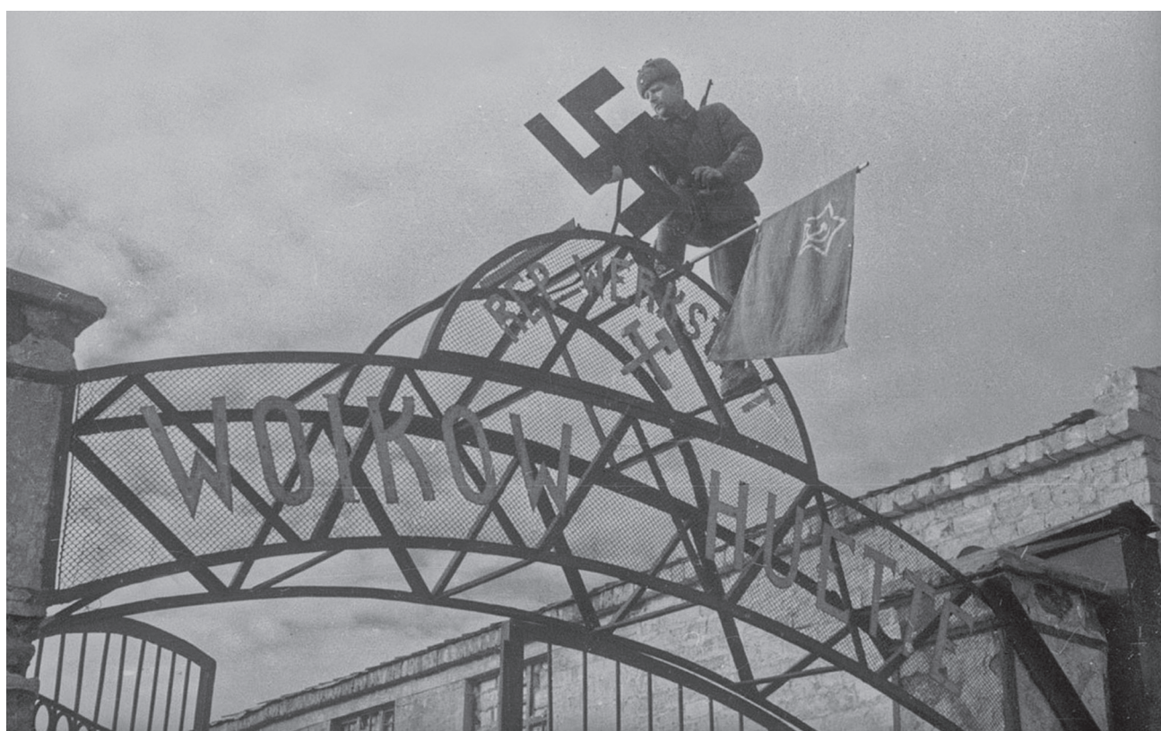
Красный флаг вместо свастики на воротах освобожденного советскими частями завода им. Войкова в Керчи