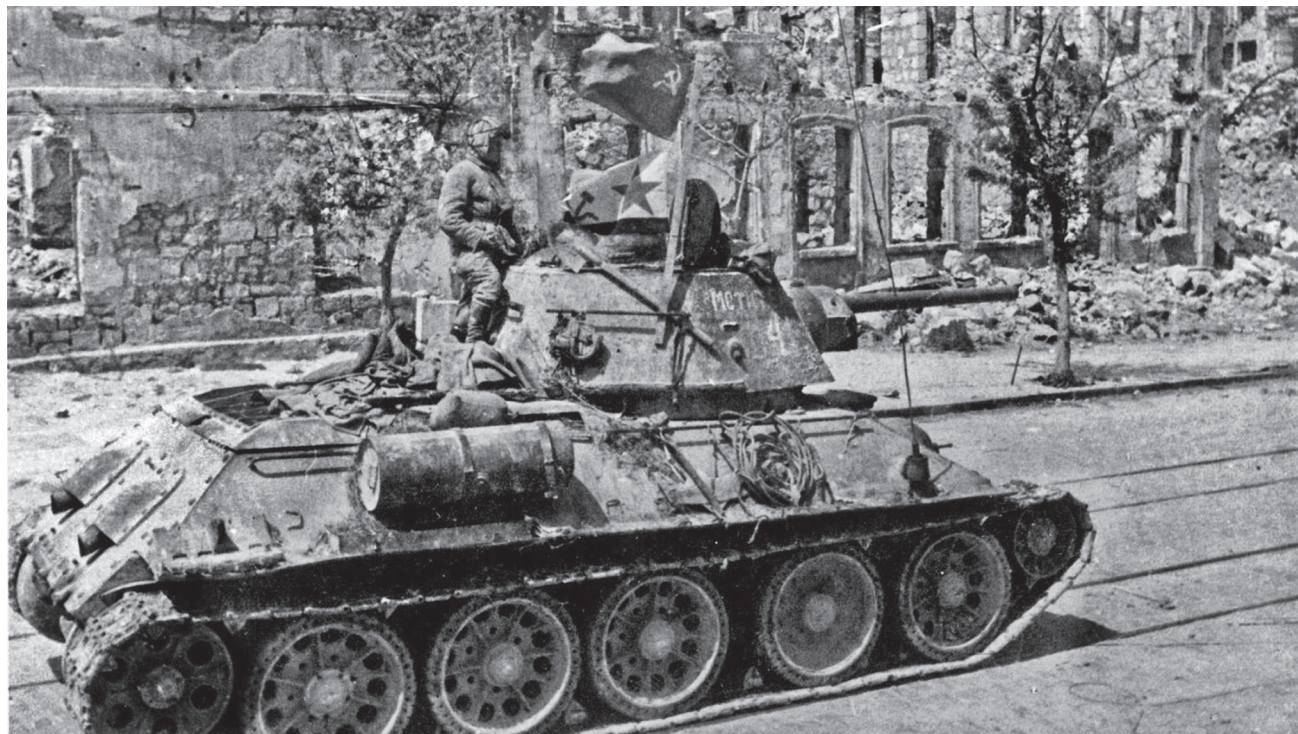
Танк Т-34 на улице освобожденного Севастополя. Начало мая 1944 г.