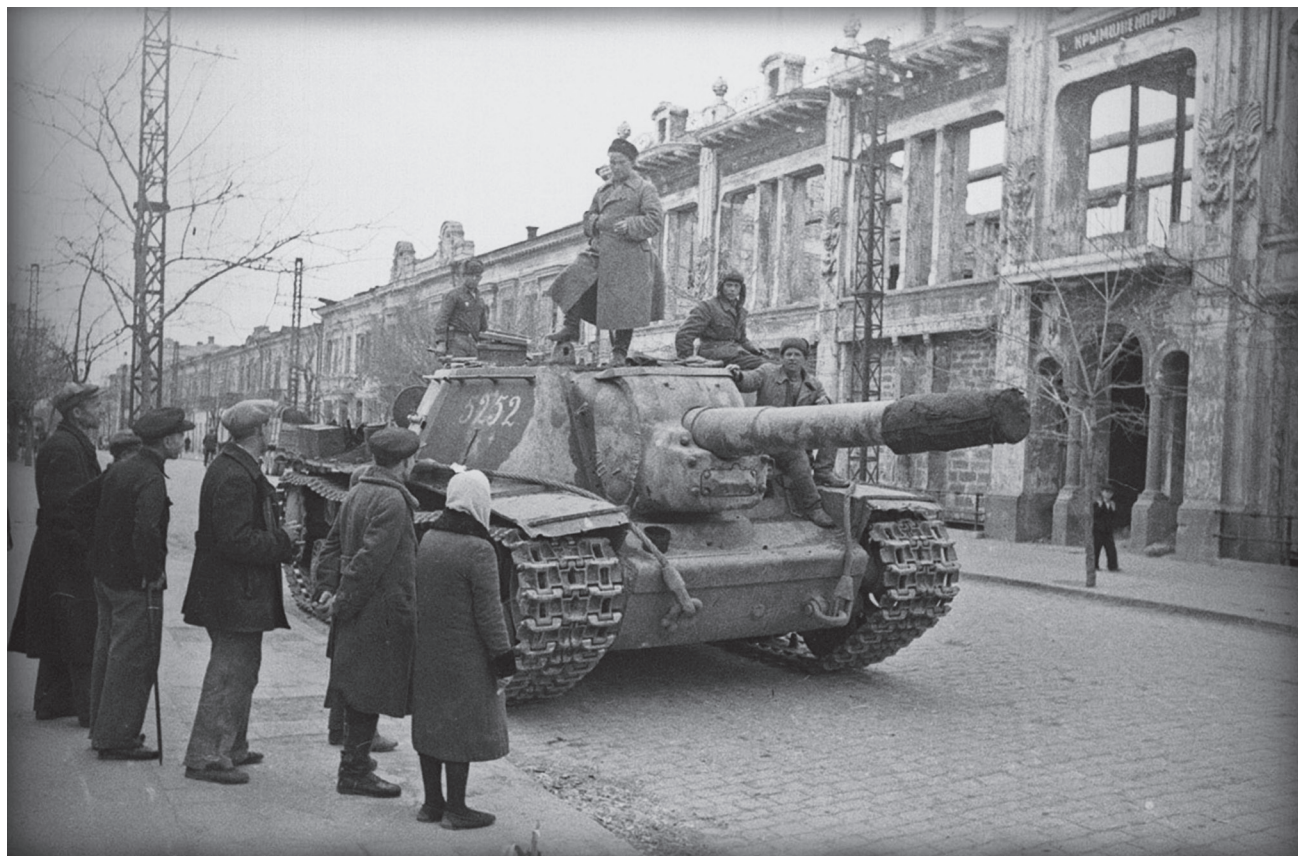
Самоходная артиллерийская установка ИСУ-152 в центре освобожденного Симферополя. Середина апреля 1944 г.