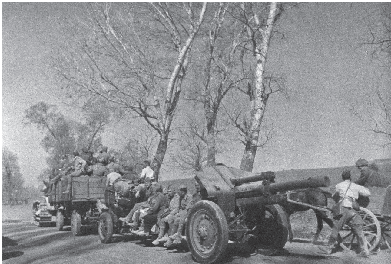
Передислокация артиллерийского подразделения на новые позиции под Севастополем