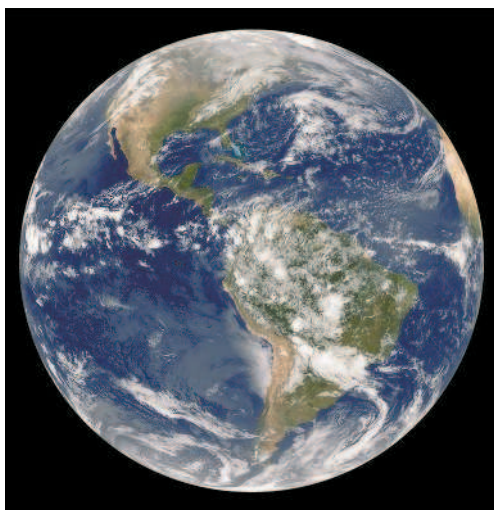
Планета Земля из космоса