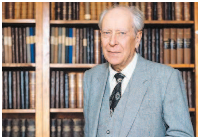
Дмитрий Сергеевич Лихачёв

Люди издавна населяют и преобразуют Землю — наш общий дом. Известный российский учёный, историк Дмитрий Сергеевич Лихачёв сказал об этом: «Когда-то... мне пришёл в голову такой образ: Земля — наш