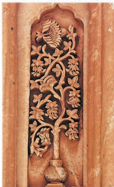
Мировое дерево в культуре разных народов