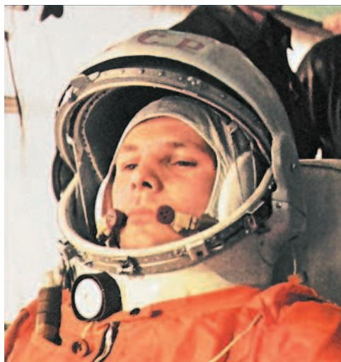
Первый космонавт Юрий Алексеевич Гагарин

Планета Земля удивительно красива. Первый космонавт мира, наш с вами соотечественник Юрий Алексеевич Гагарин, вернувшись из полёта, сказал: «Облетев Землю в корабле-спутнике, я увидел, как прекрасна наша планета. Люди, будем хранить и приумножать эту красоту, а не разрушать её!»