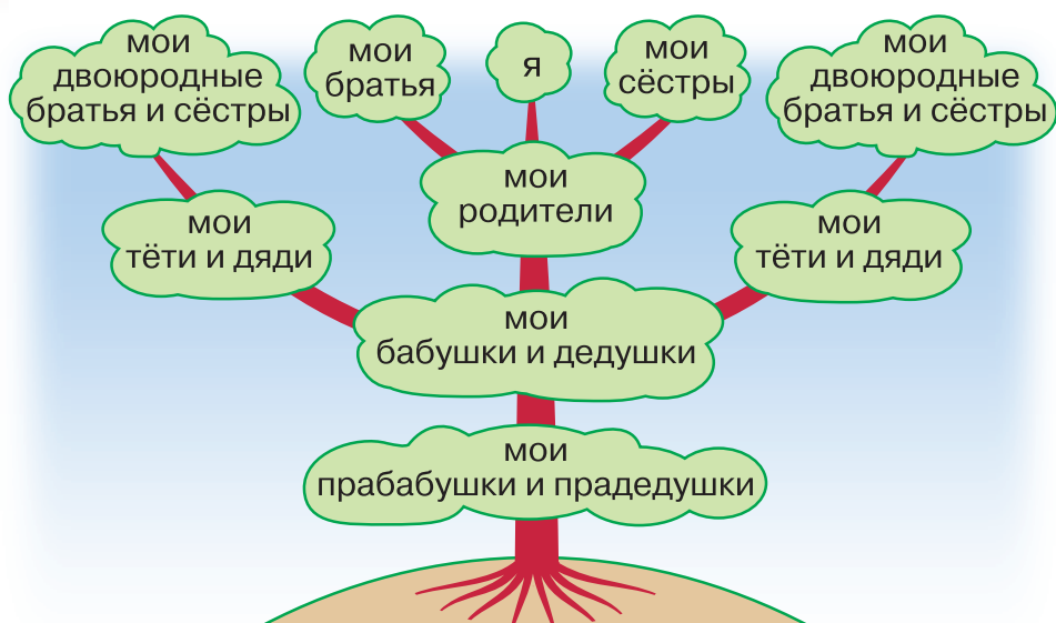
Схема родословного дерева