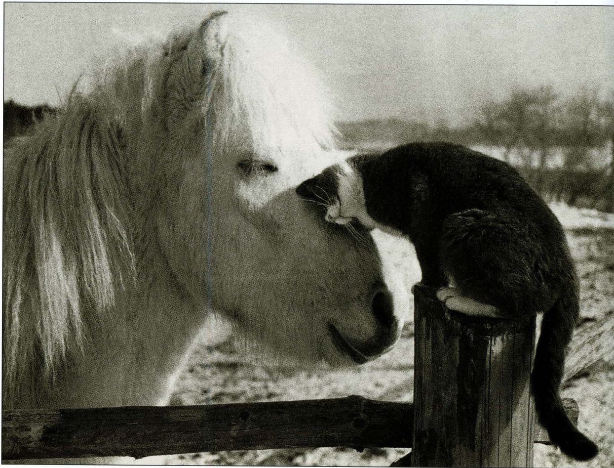
ПЕР УИЧМАНН В деревне (из серии) Швеция, 1989