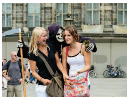
Улыбка смерти на площади Дам