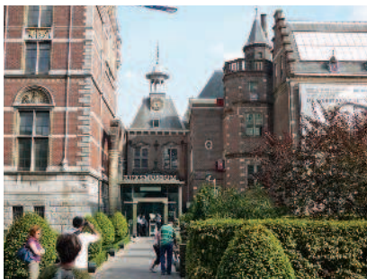
Вход в Рейксмузеум

Вечер. Загляните в расположенный рядом великолепный Концертный зал (▷82), чтобы посвятить вечер классической музыке, или забудьте об осторожности и рискните в казино Holland Casino.