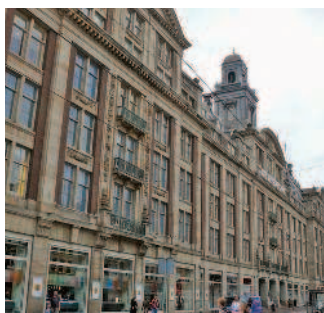
Универсам De Bijenkorf

Обед. Попробуйте роскошные блюда французской кухни в ресторане Café Roux, расположенном в отеле Grand на улице Oudezijds Voorburgwal. Менее дорогие блюда индонезийской кухни можно отведать в ресторане Sukasari на улице Damstraat.