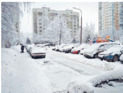
Последствия снегопада в городе

Обгон запрещается даже при отсутствии запрещающих знаков и разметки если ограничена видимость (пункт 11.4 Правил).