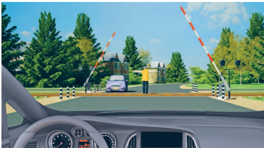
Регулировщик на железнодорожном переезде

«Регулировщик» — лицо, наделенное в установленном порядке полномочиями по регулированию дорожного движения с помощью сигналов, установленных Правилами, и непосредственно осуществляющее указанное регулирование. Регулировщик должен быть в форменной одежде и (или) иметь отличительный знак и экипировку. К регулировщикам относятся сотрудники полиции и военной автомобильной инспекции, а также работники дорожно-эксплуатационных служб, дежурные на железнодорожных переездах и паромных переправах при исполнении ими своих должностных обязанностей. К регулировщикам также относятся уполномоченные лица из числа работников подразделений транспортной безопасности, исполняющие обязанности по досмотру, дополнительному досмотру, повторному досмотру, наблюдению и (или) собеседованию в целях обеспечения транспортной безопасности, в отношении регулирования дорожного движения на участках автомобильных дорог, определенных постановлением Правительства Российской Федерации от 18 июля 2016 г. № 686 «Об определении участков автомобильных дорог, железнодорожных и внутренних водных путей, вертодромов, посадочных площадок, а также иных обеспечивающих функционирование транспортного комплекса зданий, сооружений, устройств и оборудования, являющихся объектами транспортной инфраструктуры».