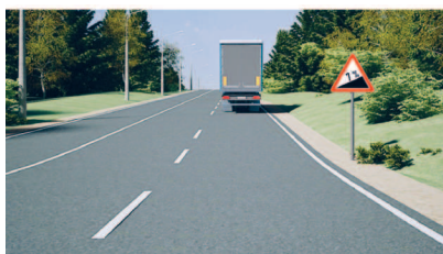
Крутой подъем дороги