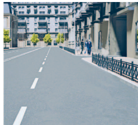
Прилегающая территория въезда во двор

« Прицеп » — транспортное средство, не оборудованное двигателем и предназначенное для движения в составе с механическим транспортным средством. Термин распространяется также на полуприцепы и прицепы-роспуски.