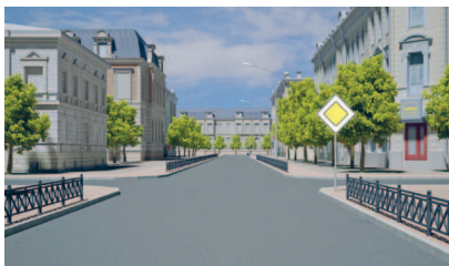
Главная дорога по знаку 2.1

При подъезде к перекрестку, где отсутствуют знаки приоритета, водителю следует снизить скорость, чтобы у него была возможность заранее распознать тип покрытия дороги, установить, не является ли пересекаемая дорога выездом с прилегающей территории и однозначно определить ее статус. При этом необходимо учитывать, что ни ширина дороги, ни конфигурация перекрестка, ни наличие на дороге трамвайных путей не определяют главную дорогу.