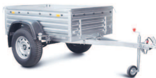
Прицеп к легковому автомобилю