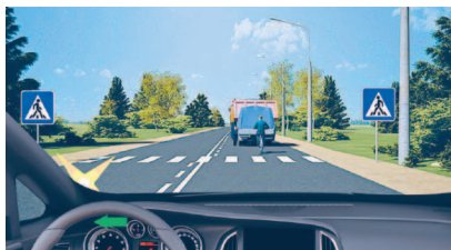
Пешеходный переход, обозначенный знаками 5.15.1, 5.19.2 и разметкой 1.14.1.

« Пешеходная и велосипедная дорожка (велопешеходная дорожка) » — конструктивно отделенный от проезжей части элемент дороги (либо отдельная дорога), предназначенный для раздельного или совместного с пешеходами движения велосипедистов и обозначенный знаками 4.5.2–4.5.7.