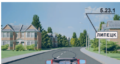
Начало населенного пункта обозначено знаком 5.23.1

« Населенный пункт » — застроенная территория, въезды на которую и выезды с которой обозначены знаками 5.23.1–5.26.