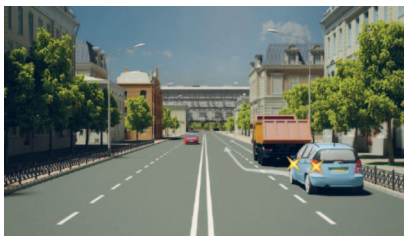
Опережение осуществляется без выезда на полосу встречного движения

Проблесковым маячком желтого или оранжевого цвета, опознавательными знаками «Опасный груз» оснащается транспортное средство, перевозящее опасный груз.