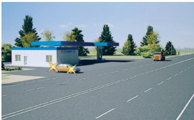
Прилегающая территория АЗС

« Прилегающая территория » — территория, непосредственно прилегающая к дороге и не предназначенная для сквозного движения транспортных средств (дворы, жилые массивы, автостоянки, АЗС, предприятия и тому подобное). Движение по прилегающей территории осуществляется в соответствии с настоящими Правилами.