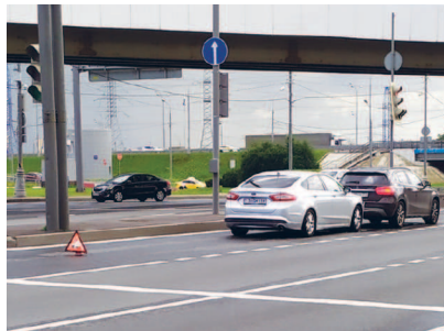
Препятствие на дороге в виде ДТП

Не является препятствием затор или транспортное средство, остановившееся на этой полосе движения в соответствии с требованиями Правил.