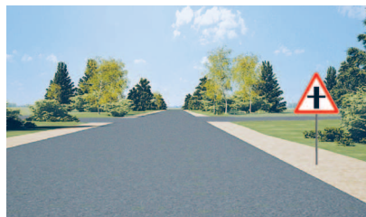
Главная дорога по знаку 2.3.1 пересечение со второстепенной дорогой

Пересечение, образованное дорогами с твердым покрытием или только с грунтовым покрытием, является пересечением равнозначных дорог.