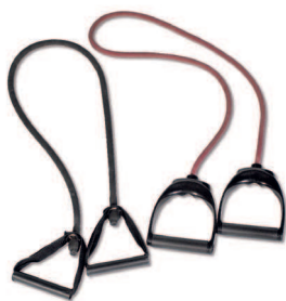
резиновые петли или резиновый жгут