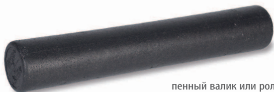
пенный валик или ролик