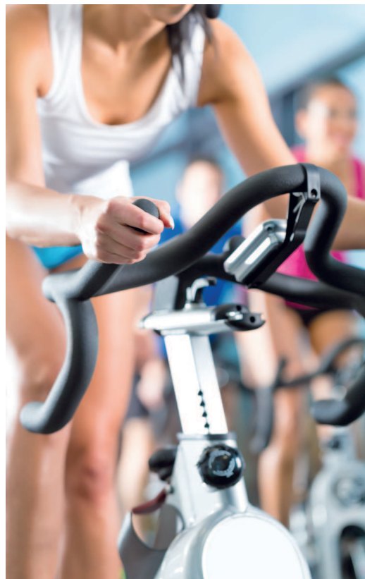
Дополнительные упражнения на каждый день помогают избежать мышечного дисбаланса.

Помимо всего этого функциональная методика учит вас задействовать несколько мышц одновременно, фокусироваться на гибкости, балансе и частоте движений. Многозадачность помогает вам повысить тонус и приобрести желаемую форму более эффективно, оправдывая проведенные часы на коврик для фитнеса или в тренажерном зале.