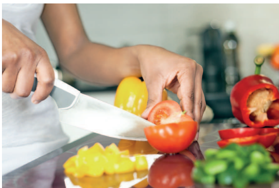
Выбор в пользу здорового питания будет дополнять режим тренировок и усиливать эффект.

Диета является важным дополнением к режиму тренировок. Как и в случае с физической нагрузкой, подумайте о диете с точки зрения функциональности. Помимо бесчисленных приятных качеств диеты — это очень важно само по себе! Ведь еда нужна нам для того, чтобы подпитывать наш образ жизни. Не всякая диета подойдет каждому человеку, так как все тела имеют индивидуальные потребности. И для того чтобы подобрать здоровую, сбалансированную диету, важно проводить регулярный анализ крови для определения уровня холестерина и того, получаете ли вы достаточное количество различных витаминов. Попробуйте обратить внимание на чувствительность вашего тела: если после обеда