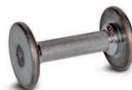
гантели и штанги