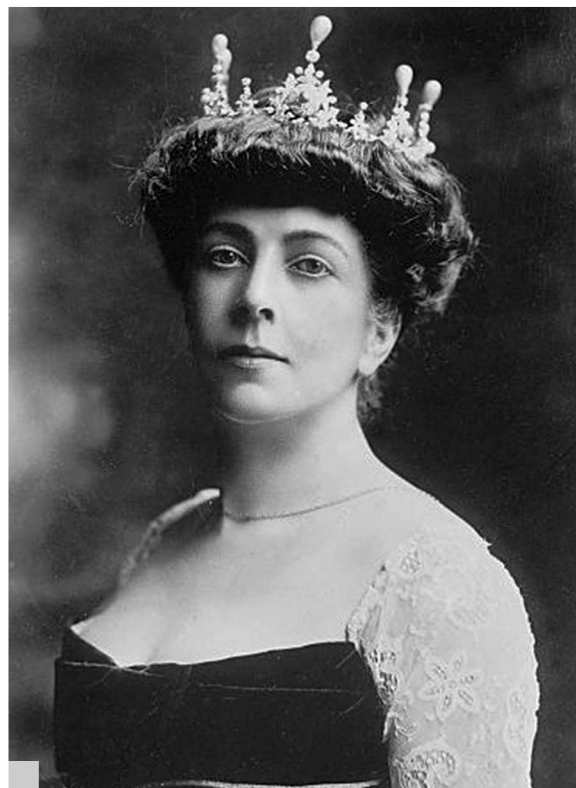
Дженни, мать Уинстона Черчилля, 1913

Выйдя замуж, Дженни с головой окунулась в светскую жизнь, для которой она была буквально создана. Красота, сильный характер, острый ум и умение себя подать надолго сделали ее королевой светских салонов. Правда, для реализации всех своих амбиций ей вечно не хватало денег. Как верно пошутил один из ее знакомых: «Дженни смело можно отнести к такому типу женщин, для которых иметь меньше сорока пар туфель означает прозябать в нищете».