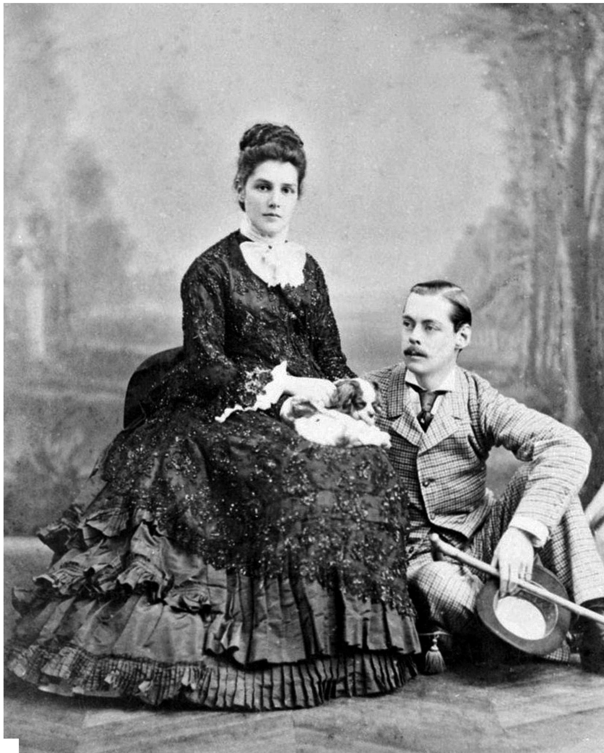
Лорд Рэндольф Черчилль и леди Джейн Джером