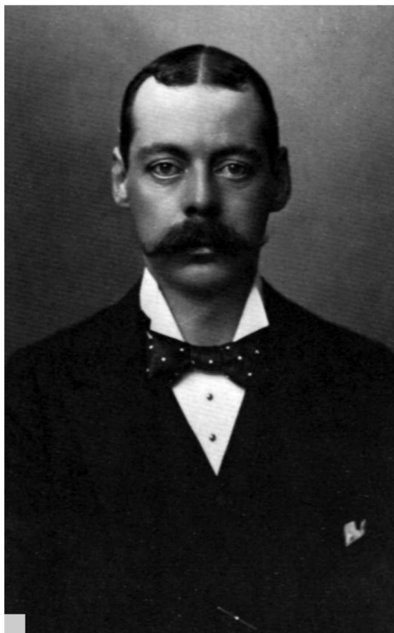
■ Сэр Рэнгольф Черчилль, отец Уинстона Черчилля

Отец Дженни, потомок французских эмигрантов Леонард Джером, был личностью интересной — адвокат, биржевой спекулянт, «акула» с Уолл-стрит, американский консул в Триесте, совладелец «New York Times» и Тихоокеанской почтовой паровой компании, яхтсмен, картежник, любитель женщин и лошадей — и это еще не полный список его занятий и увлечений. Мать Дженни, Кларисса, была не столь эффектной персоной, зато от нее она унаследовала примечательную внешность — черные глаза и волосы и смуглую кожу.