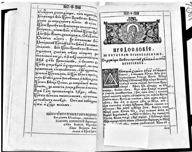
Рис. 4. Первые страницы «Жития Печерских святых», напечатанных в Киево-Печерской Лавре при архимандрите Иоасафе Кроковском: ко-нец посвящения Петру I и начало Предисловия к православному чита-телю, содержащего ответы «противу хулениям на святых печерских».