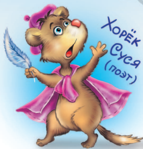
Хорёк Суся (поэт)

но это неважно. Крот наш, Шиша, новый туннель взялся рыть, под рекой. Ему кто-то наболтал, что там клад, вот он и роет. Так что теперь к реке так просто не подойдёшь, всюду то яма, то канава.