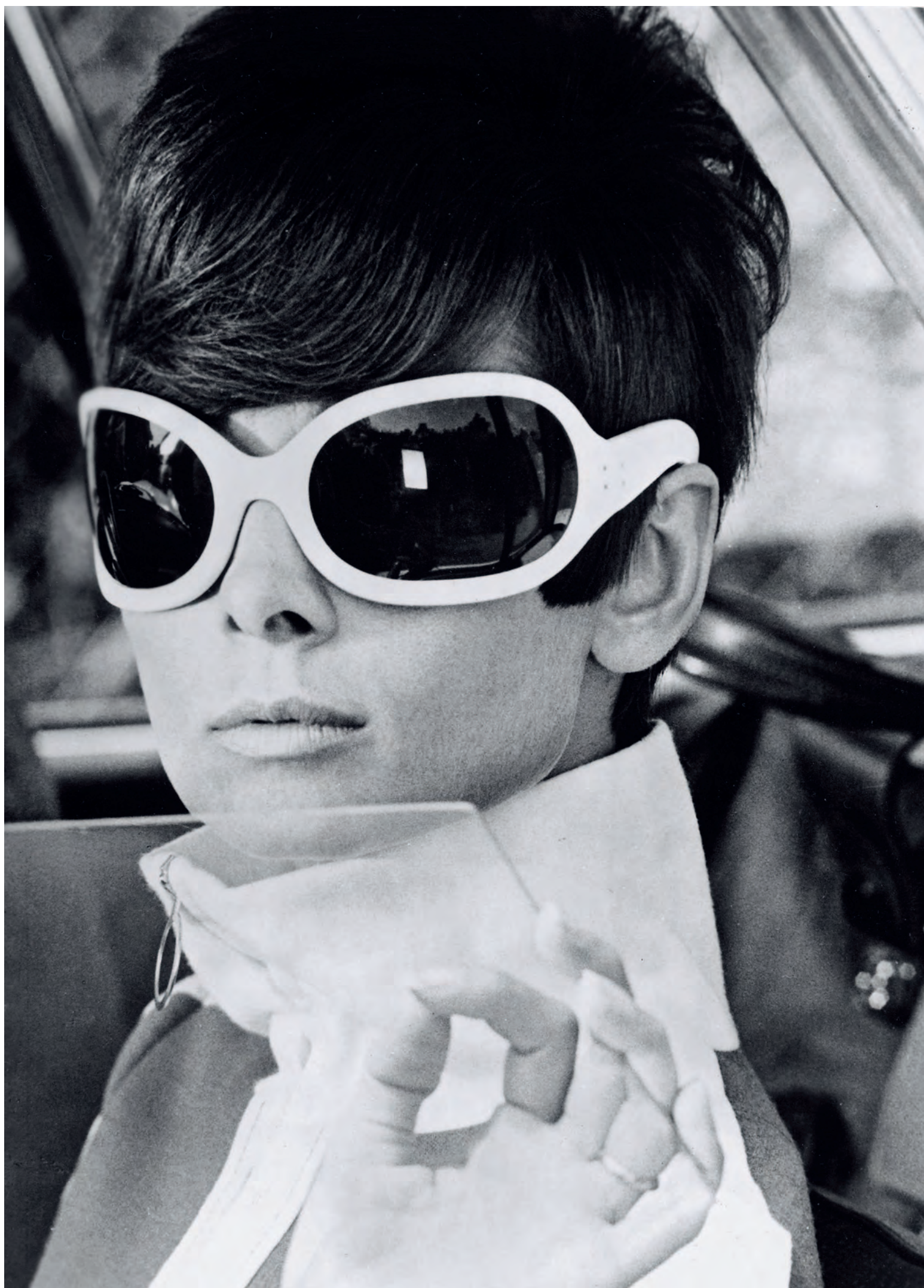
Одри Хепберн в фильме «Двое на дороге». На ней солнцезащитные очки от Куррежа, вариант его «эскимосских» очков.