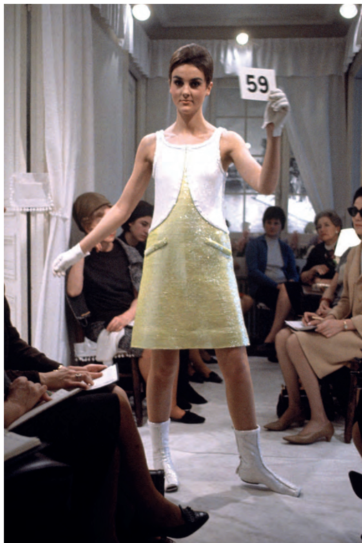
В 1960-х годах Курреж вместе с Мэри Куант популяризовал цельнокройное платье А-силуэта. Его творения были созданы, чтобы скользить по телу, а не облегать его.

Курреж был единственным художником по костюмам в фильме «Бассейн» (1969). Его образы для Марианны (Роми Шнайдер) и Пенелопы (Джейн Биркин) — это капсульная ретроспектива каталога дизайнера шестидесятых годов: расклешенные платья-рубашки с заниженной талией и контрастным кантом, платья-халтер с принтом в виде завитков, голубые брюки-сигареты и рубашки