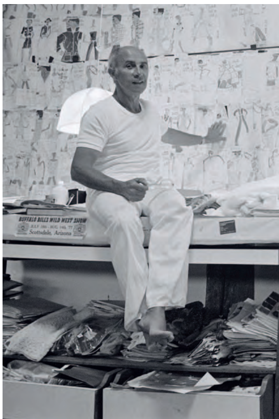
Андре Курреж в своей мастерской на ферме в Стране Басков в 1978 году.

Страница 14. Простое черное бикини от Андре Куррежа для Роми Шнайдер в фильме «Бассейн». Лаконичный дизайн характерен для минималистского подхода Куррежа к моде.