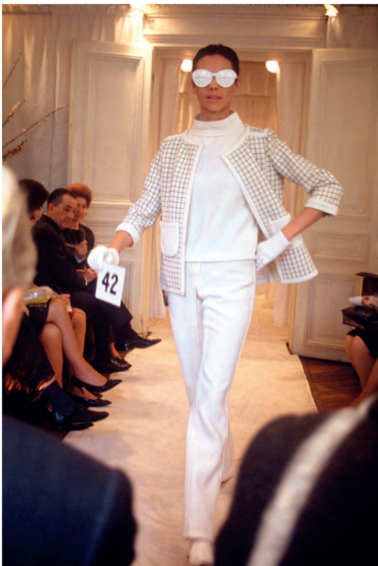
Знаменитые «солнечные очки эскимоса» от Куррежа, прототипом для которых стали снежные очки инуитов, впервые были показаны в коллекции «Лунная девушка» в 1965 году.

вклад был небольшим, но как часть дизайнерской эстетики Хепберн, выдержал проверку временем. Хепберн сыграла Джоанну, которая в начале картины предстает как простая наивная девушка и заканчивает ее как замужняя женщина на грани развода, облаченная с головы до ног в последние творения космической моды. Фильм «Двое на дороге» стал одним из самых культурно значимых проектов актрисы, так как он показал seismicкое изменение на рынке моды, которое актуально и сейчас. Юность одержала окончательную победу. Начиная с шестидесятых годов одежда предназначается для подростков, а взрослым женщинам, подобным Хепберн, бывшим когда-то завзятыми модницами, остается только играть в догонялки. Курреж предоставил для съемок картины «Двое на дороге» очки от солнца в своем фирменном «эскимосском» стиле — с прорезями для глаз, представленные в 1965 году. Но очки Хепберн в фильме все-таки более практичны.