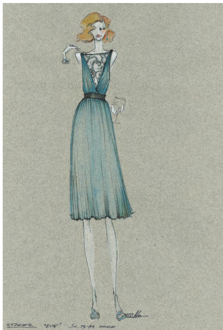
Платье от Эли Сааба для Эвелин, персонажа Николь Кидман в фильме «Порочные игры», было выбрано для фильма костюмерами Бартом Мюллером и Куртом Свенсоном. Набросок Барта Мюллера.