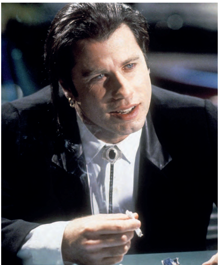
Костюмер Бетси Хайман добавила кожаные лацканы к черному костюму от Аньес Б., который Джон Траволта носил в «Криминальном чтиве», чтобы придать ансамблю нотку стиля рокабилли.