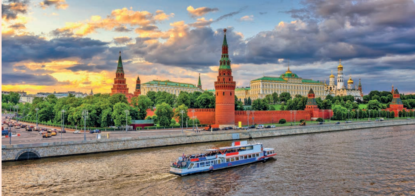
Набережная Кремля и Москва-река

условия для путешественников, предлагая им пешие прогулки, автобусные экскурсии, водные круизы и активные виды спорта и отдыха.