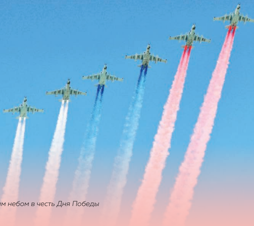
Авиашоу над московским небом в честь Дня Победы