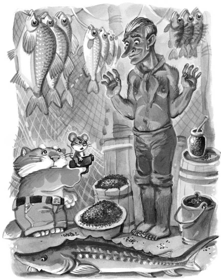
Рисунки И. Савченкова