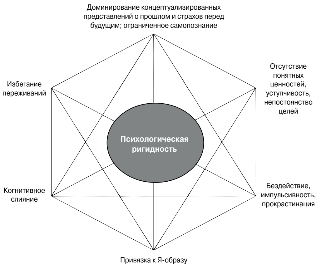
Рис. 1.2. АСТ-модель психопатологии

ному разделению. Привязка к Я-образу противопоставляется способности к трансцендентному самоощущению (Я-контексту). Доминирование концептуализированных представлений о прошлом, страх перед будущим и ограниченное самопознание — процессы, обратные осознанию настоящего момента. Отсутствие четко сформулированных ценностей, выбор “ценностей” по необходимости (следуя социальным нормам) и непостоянство целей — патологические аналоги ценностей в АСТ. И наконец, бездействие, импульсивность и прокрастинация — это антиподы проактивности. В целом с точки зрения АСТ патологической основой проблем становится психологическая ригидность (рис. 1.2).