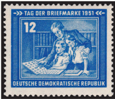
ГДР, 1951 г. Марки, наклеенные на соседние страницы, будут повреждать друг друга

гии и ГДР, на которых показано, как дети с увлечением рассматривают марки.