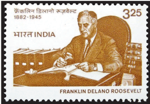
Индия, 1983 г. Франклин Делано Рузвельт — один из самых известных филателистов

Но вернемся к вопросу о научности коллекционирования марок. Конечно, филателия все еще не в силах соперничать, например, с нумизматикой. Как известно, первые монеты отчеканены несколько тысячелетий назад, а первые нумизматические коллекции, касающиеся преимущественно античного периода, появились в Италии в XIV–XV веках. Тщательное изучение монет началось задолго до появления марок в XVIII веке. Научная составляющая той же нумизматики столь велика, что порой находка одной-единственной монеты с именем и изображением правителя позволяет восполнить большие пробелы в истории. Марки пока не могут играть ту весомую роль в изучении истории, какая отводится предметам нумизматики, археологии, палеографии.