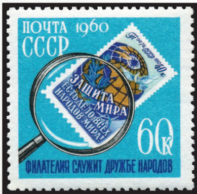
СССР, 1960 г.

Но у почтовых миниатюр все впереди, они в своем массиве накапливают всё больше и больше информации и, как старательный летописец, год за годом фиксируют всё, что происходит в мире. Выстроенные в хронологическом порядке, они уже сейчас точно отражают переживаемые любой страной политические события, уровень ее технического и художественного развития в тот или иной период. Причем у марок есть большое преимущество: они эмоциональны. Помещенные на них лозунги и пояснительные