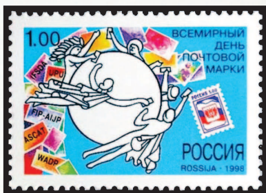
Россия, 1998 г.

Это удивительно, но совершенно точно известен день рождения общепринятого термина «филателия». Французский коллекционер Жорж Эрпен (1820–1900) предложил его в статье, опубликованной в журнале Le Collectionneur de Timbres-poste («Коллекционер почтовых марок») 15 ноября 1864 года. Ему совершенно не нравилось применявшееся в то время название нового хобби — timbromanie , в вольном переводе с французского «маркомания». И он предложил сочетание двух греческих слов: φιλέω — «любить», и ἀτέλεια — «освобождение от оплаты», что относится к функциям почтовой марки. Термин был принят единодушно. Давайте же и мы будем любить филателию — она того стоит!