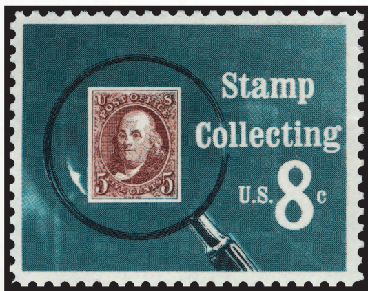
США, 1972 г.

В длинную «марочную летопись» внесено невероятное количество ошибок художников, редакторов и полиграфистов, множество несуразных и смешных ситуаций. Кажется, что изучение такого материала могло бы заставить создателей почтовых миниатюр подходить к их эмиссии более внимательно и навсегда оградить эти выпуски от новых провалов — однако, вопреки всем стараниям, ошибки на марках появляются вновь и вновь. Острые насмешки в средствах массовой информации и частое упоминание прежних курьезных выпусков вроде бы должны смущать коллекционеров, пробуждать желание откреститься от таких неудачных марок и скорее забыть эти злополучные страницы филателистической истории. Но происходит обратное: коллекция ошибок на почтовых марках не только не вызывает отказа от такого скандального прошлого, но и подогревает еще больший живой интерес к филателии в целом.