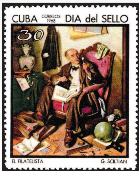
Куба, 1968 г. Картина Григория Ивановича Шилтьяна «Филателист»

Никто точно не считал, сколько же сюжетов почтовых миниатюр выпущено после появления в 1840 году первой в мире наклеиваемой марки. Благодаря своему цвету и заявленной стоимости в 1 пенни этот первенец филателии получил всем известное сегодня название «Черный пенни». Не поддается подсчету и то, сколько конвертов и почтовых карточек выпущено во всех странах с 1818 года, когда в Сардинском королевстве была впервые введена в обращение бумага для писем с пред-