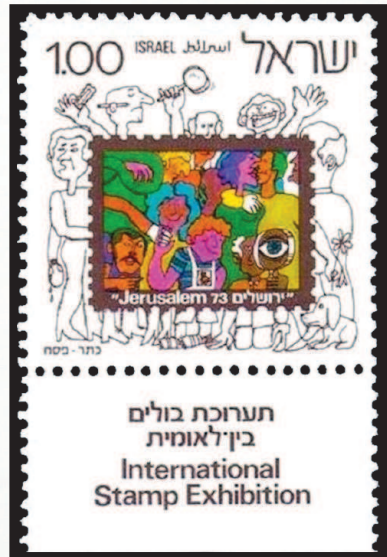
Израиль, 1973 г. Филателии все возрасты покорны!

рода на Неве. Санкт-петербургскую секцию организовал Федор Львович Брейтфус (1851–1911) и оставался ее бессменным председателем до самой смерти. Его коллекция в то время являлась третьей в мире по величине, уступая лишь собраниям Филиппа Феррари (1848–1917) в Париже и Томаса Таплинга (1855–1891) в Лондоне. С марта 1896 года С. Д. Соломкин в Киеве начал издание отечественного журнала «Марки». Это был, как указано на его обложке, «первый русский иллюстрированный ежемесячный журнал для любителей и собирателей почтовых и иных марок».