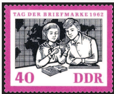
ГДР, 1962 г.