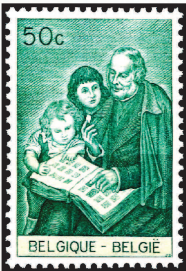
Бельгия, 1965 г. Изобретатель почтовой марки сэр Роулэнд Хилл. Ошибка художника: марки сейчас так не хранят

С точки зрения любого современного филателиста, в рисунках допущены вопиющие ошибки: драгоценные знаки оплаты размещены в альбомах на обеих сторонах листа без проклад-