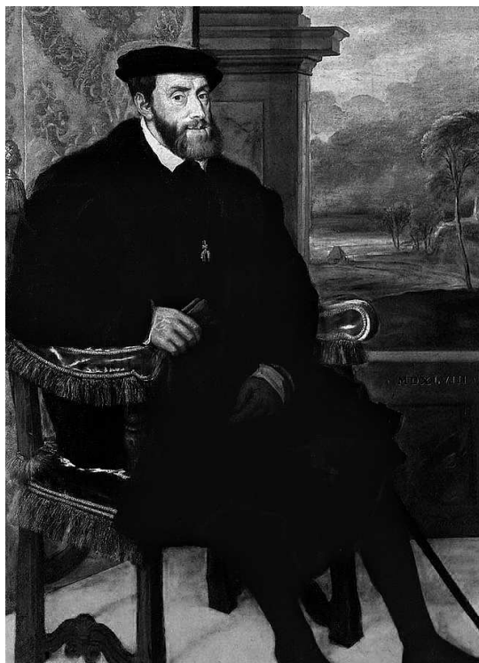
Тициан. Портрет Карла V в кресле. 1548. Старая пинакотека, Мюнхен

Венецианцы обожали женскую красоту, но в их живописи отсутствует какая-то женская активность в жизни. Женщины там присутствуют больше для любования. А «Сельский концерт» можно назвать пасторалью, причем не просто пасторалью, а пасторалью идеальной: в ней есть гармония всего со всем, гармония мира с человеком, растворенным в этой природе. Посмотрите на эти линии рук, на прозрачный кувшин... И картина называется «Концерт» не из-за того, что эти люди исполняют музыку, а потому что в ней есть то, что есть в концерте: созвучие всех инструментов и предметов. Картина имеет свой собственный голос, и все вместе созда-