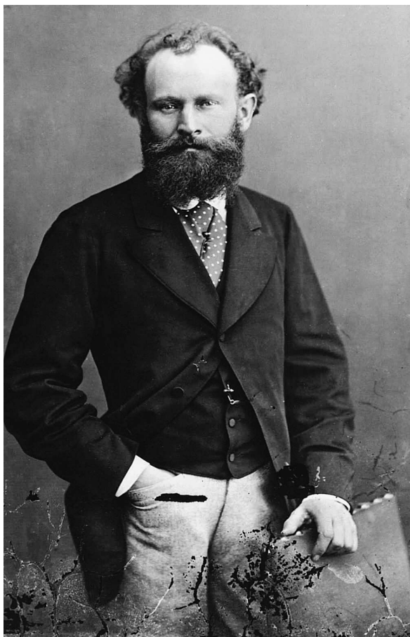
Эдуард Мане, портрет

взгляде на нее можно было бы решить, что ее написал кто-то из импрессионистов.