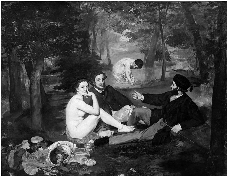
Эдуард Мане. Завтрак на траве. 1863. Музей Орсе, Париж

С картиной Джорджоне и перекликается картина Мане «Завтрак на траве». Здесь совершенно удивительный новый жанр: природа, летняя истома, деревья, тишина, ничего нет в лесу, только пикник, квартет — двое одетых мужчин и две обнаженные женщины. И эта картина, как и «Олимпия»,