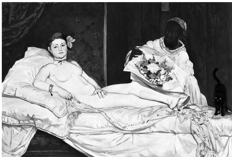
Эдуард Мане. Олимпия. 1863. Музей Орсе, Париж

произвела взрывной эффект. Началась дискуссия — и вокруг картины, и вокруг личности художника. Все отлично понимали, до какой степени это все отличается от того, к чему привык зритель.