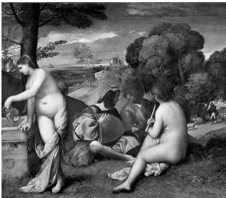
Джорджоне. Сельский концерт. 1508–1509. Лувр, Париж

На картине Джорджоне «Сельский концерт» мы видим обнаженные женские фигуры и одетые мужские. Это такой своеобразный пикник. Группа людей сидит на холме и музицирует — у них в руках музыкальные инструменты. Посмотрите, как написаны женщины — словно плоды. Надо сказать, что флорентийские художники писали женщин длинными, худыми, истеричными и напряженными, хотя флорентийки всегда были толстушками. А на картине Джорджоне женщины похожи на позднеантичных венер.