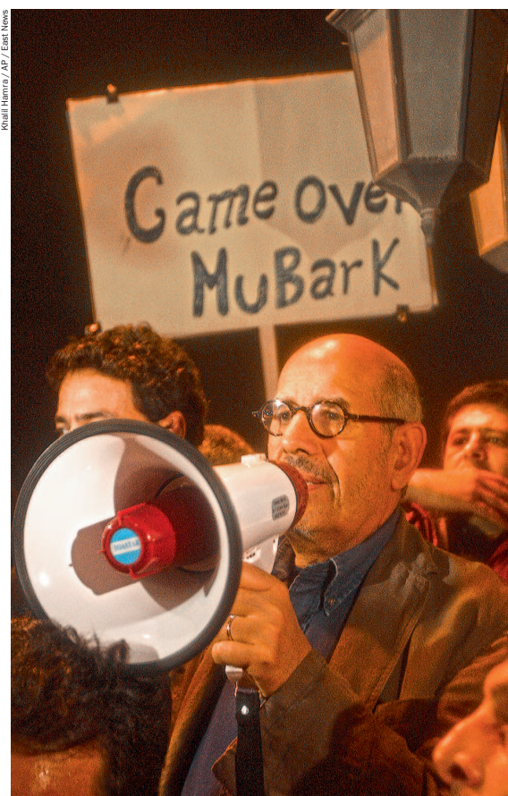
Мохаммед аль-Барадеи на митинге в Каире. Лидером оппозиции экс-глава МАГАТЭ не станет