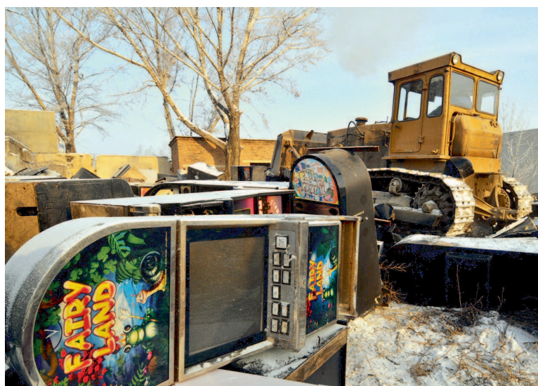
Ликвидация подпольных казино в Подмоскowie – война недавних коллег по прокуратуре

Известно всем, Что общий дом под именем СК Возьмет заботу обо всём, Коль в доме есть беда.