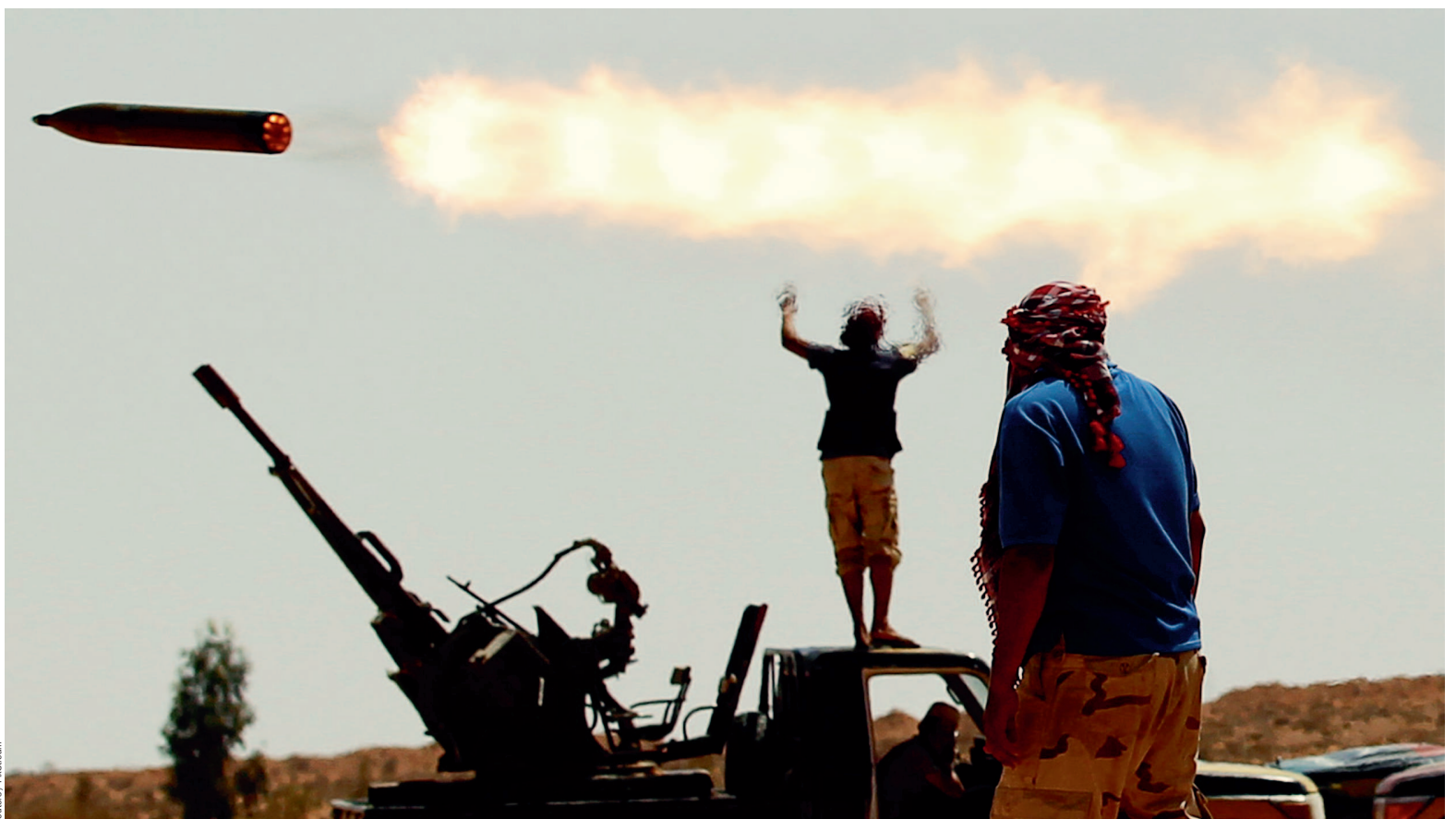
Даже при поддержке Запада ливийские повстанцы воюют с Каддафи более полугода

В Ливии, где 42 года царствует полковник Муаммар Каддафи, протесты быстро