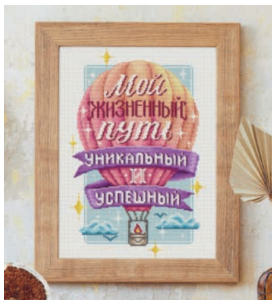
С. 23, 74