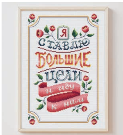
С. 21, 50