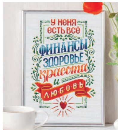
С. 25, 80