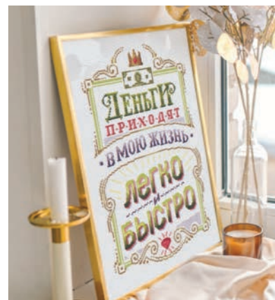
С. 19, 68