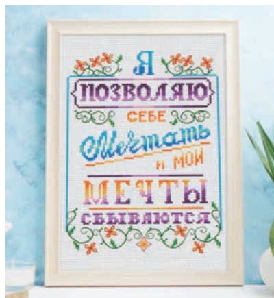
С. 15, 56