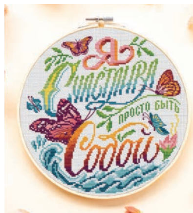
С. 37, 122