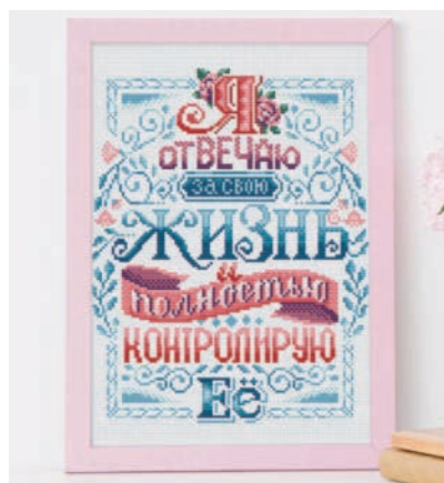
С. 9, 38