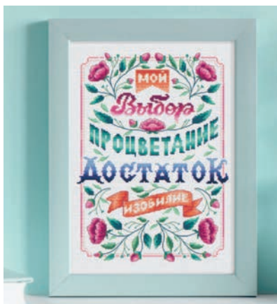
С. 33, 98