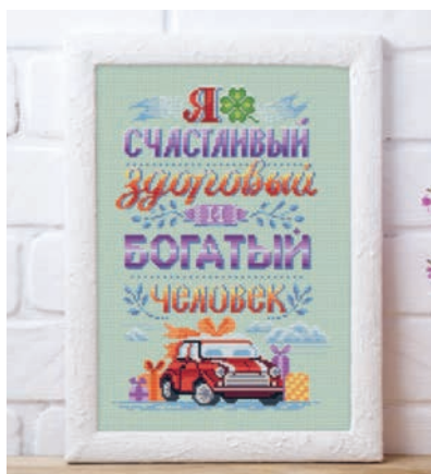
С. 29, 86