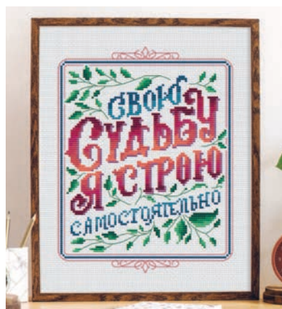
С. 11, 44