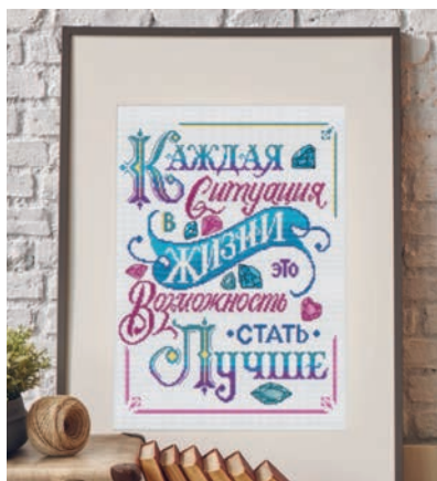
С. 35, 104