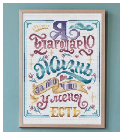
С. 31, 92