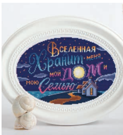
С. 27, 116