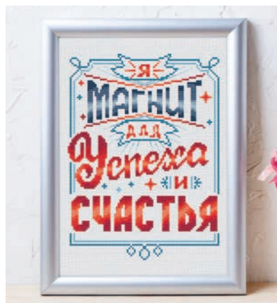
С. 17, 62