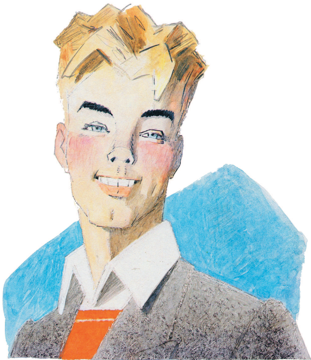
Рисунки Ю. Коровина