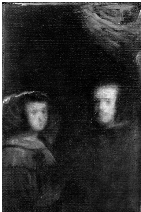
Диего Веласкес. Менины. Портрет Филиппа и его супруги Марианны — отражение в зеркале, висящем на дальней стене ателье (деталь). 1656. Музей Прадо, Мадрид

В мастерской художника особая атмосфера из-за жидкого света, который проникает в это пространство. Это необыкновенное живое пятно света и цвета, а вовсе не живопись, о которой мы будем говорить далее. Так вот, мы стоим между девочкой, ее свитой, художником Веласкесом и теми, кого он пишет. А кого же пишет Веласкес? Это очень интересно. Мы не можем оглянуться и посмотреть на тех, кого он пишет, но мы догадываемся, кто это. Он, по всей вероятности, пишет тех, кто отразился