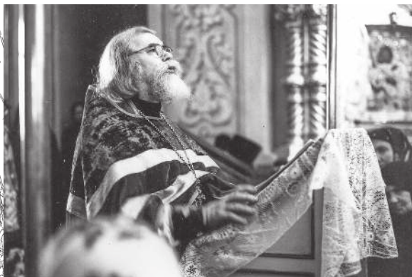
Проповедь, 1980-е годы

общение человеческое, приближающее их к Духу Христову. И на этой первой ступени добра, о которой Господь сказал как о подаче стакана воды «во имя ученика», могут стоять все, как и правильно понимать эти слова Христовы и стремить-