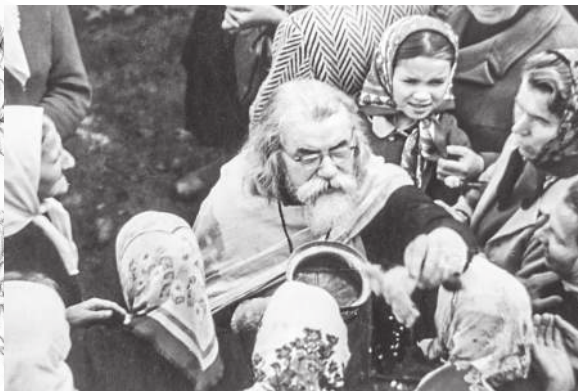
Окропление святой водой, 1980-е годы

Дивный путь «малых дел», пою тебе гимн! Окружайте, люди, себя, опоясывайтесь малыми делами добра — цепью