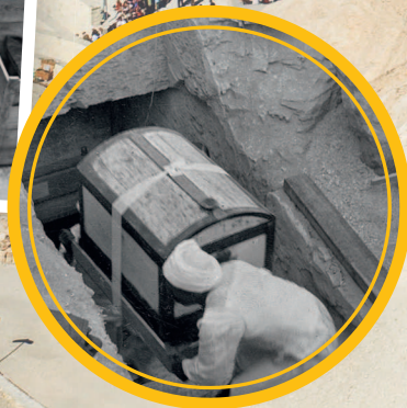
Рабочие подняли на поверхность более 50 сундуков, наполненных украшениями и драгоценностями.