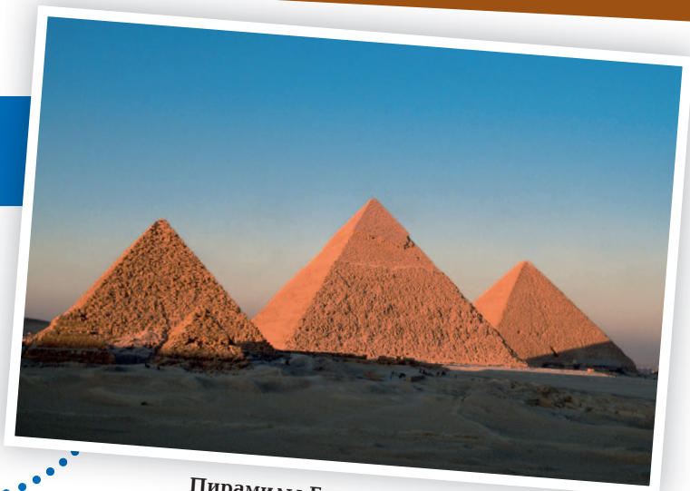
Пирамиды Гизы. Какие тайны скрываются за этими мощными стенами?