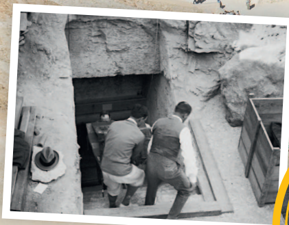
Крутая подземная лестница ведёт в первую камеру погребального комплекса.