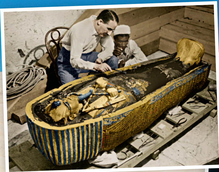
Говард Картер исследует мумию Тутанхамона. Лицо правителя покрывает маска из кованого золота.

В центре камеры находится огромный деревянный ковчег, сплошь украшенный золотом. Он занимает почти всё пространство. Картер сразу видит, что магическая печать царского захоронения невредима, а значит, в эту комнату со времени погребения фараона не ступала нога человека. Ковчег открывают. В нём находится второй, поменьше, за ним следуют третий и четвёртый, сделанный из чистого золота. В нём археологи находят саркофаг с мумией царя Тутанхамона в маске, теперь уже всемирно известной. Сообщение о сенсационной находке распространяется по миру со скоростью лесного пожара. Говард Картер и лорд Карнарвон достигли цели и осуществили свою мечту! Они нашли то, что так долго искали, — сокровища фараона!