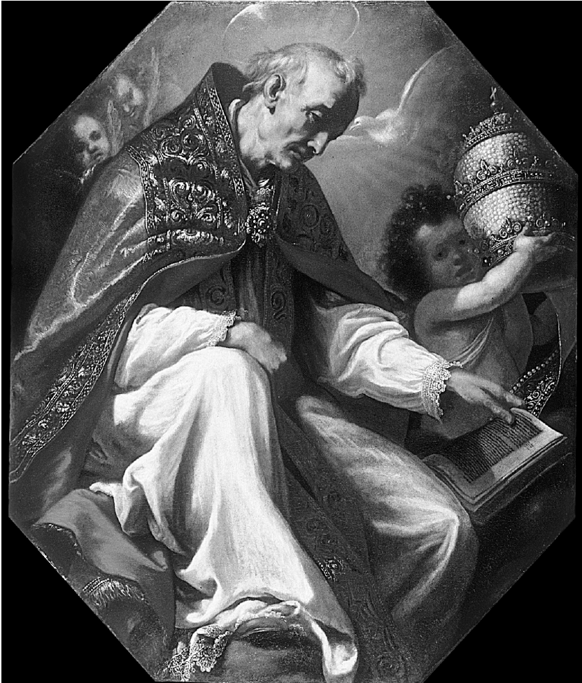
Якопо Виньяли. Св. Григорий Великий. Ок. 1630. Художественный музей Уолтерс, США

евреев, обедневших после своего крещения вследствие потери дохода в еврейской общине или наследства, — даже назначать им умеренную пенсию. Очевидно, епископы слушались его через раз (что верно для папства той эпохи в целом). Ему возражали, что такие обращенные будут неискренни, выбирая христианство ради пенсии, а не ради веры в Иисуса, на что Григорий отвечал, что зато