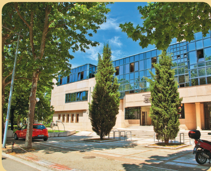
■ Черногорский народный театр в Подгорице

Адреса и телефоны музеев, а также время работы и стоимость посещения находятся в соответствующем разделе путешественника.