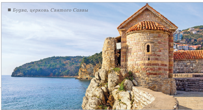
■ Будва, церковь Святого Саввы