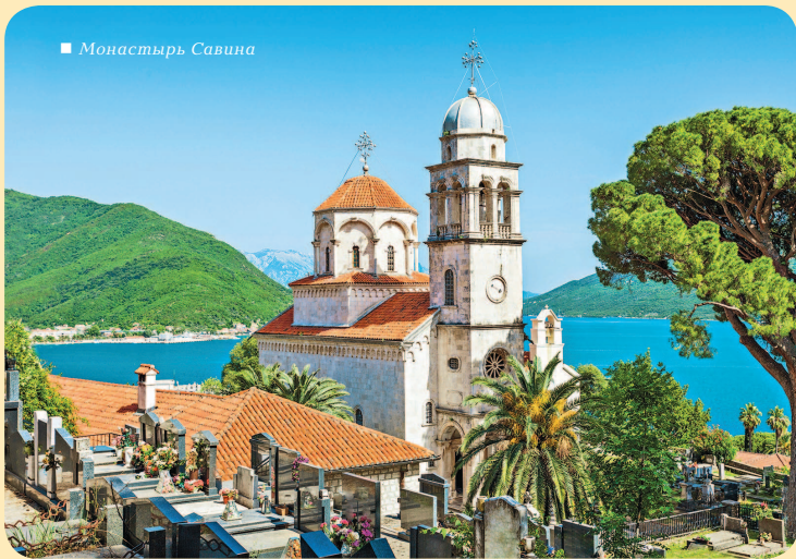
■ Монастырь Савина

КАК ДОБРАТЬСЯ: из Будвы автобусом 2 ч (5€), далее пешком.