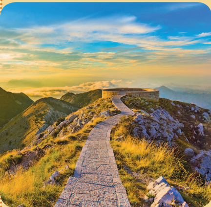
■ Мавзолей Негоша – самый высокий в мире