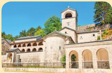
■ Цетиньский монастырь

А потому в Черногории удалось сохранить уникальную христианскую реликвию – десницу Иоанна Крестителя, заключенную в тот самый ковчег. Согласно Библии, имен-