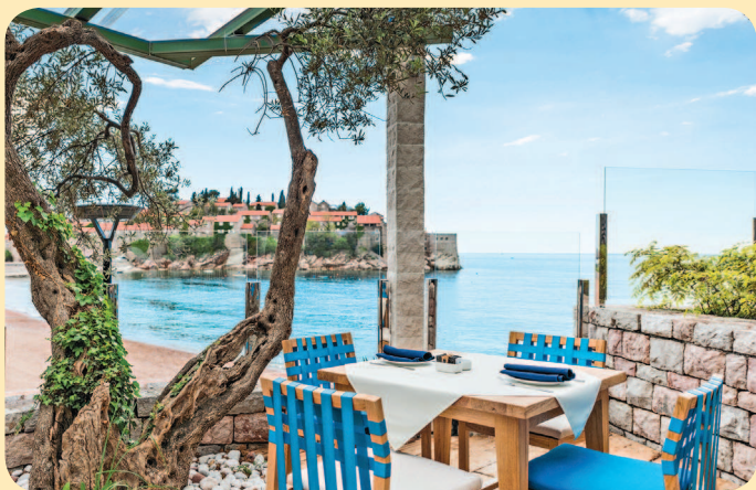
■ Кафе на острове Свети-Стефан

Например, в Археологическом музее Будвы (Arheoloski muzej Budva), где представлены экспонаты древних культур – от монет и посуды до предметов военного облачения. Или в Историческом музее Черногории (Istorijski muzej Crne Gore) в Цетинье, где можно познакомиться с историей страны, начиная от эпохи палеолита и заканчивая современным периодом. А может быть, за стеной дождя вас заинтересует Морской музей Котора (Pomorski muzej, Kotor), где выставлено все, что связано с морской славой Бока-Которской, – судовые журналы, навигационное оборудование, модели кораблей и т.п.