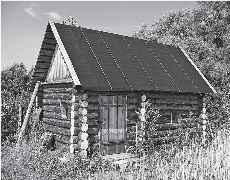
Иллюстрация 1. Современная версия деревенской бани “по-черному”. Новгородская область, 2004 год.

людная нагота может способствовать честности и эмоциональной близости, но она же порой порождает распушенность и уязвимость 2 .