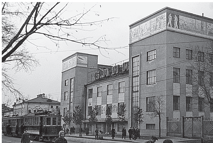
Иллюстрация 2. Баня в центре Москвы, построенная в период правления И. Сталина в 1935 году.