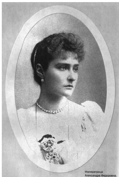
Императрица Александра Федоровна.

Молодая немецкая принцесса, дочь Великого герцога Гессен-Дармштадского Эрнеса Людвига IV и Алисы Английской. Она родилась в Дармштадте в 1872 году.