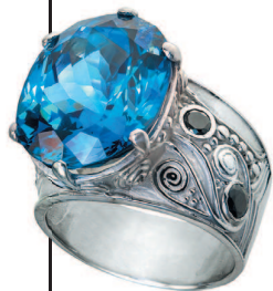
Кольцо с аквамарином

Нежные оттенки аквамарина хорошо впишутся в летний и весенний гардероб. Выбирать украшения лучше в оправе белого или серебристого цвета: платина, белое золото, серебро.