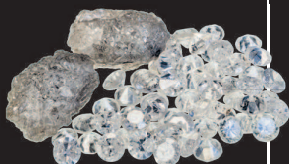
Канадские бриллианты. Месторождение Ека́ти