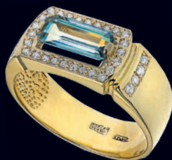
Мужское кольцо с александритом и бриллиантами

В высшем свете царской России носить александрит полагалось в обрамлении двух бриллиантов, подерживая благие деяния царя Александра II: отмену крепостного права и реформу судебной системы.