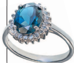
Кольцо с аквамарином