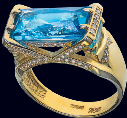
Кольцо с аквамаринoм и бриллиантами

Литотерапевты говорят о положительном влиянии аквамарина на зрение, и, пожалуй, это один из тех редких случаев, когда официальная наука полностью согласна с их мнением. Во-первых, это один из самых чистых и прозрачных камней в природе. Во-вторых, кристаллы этого минерала могут быть очень большими. Эти два фактора послужили причиной того, что с XII века из аквамарина изготавливали линзы для очков. Естественно, что владеть таким оптическим прибором, целиком состоящим из драгоценного камня, могли лишь очень богатые люди.