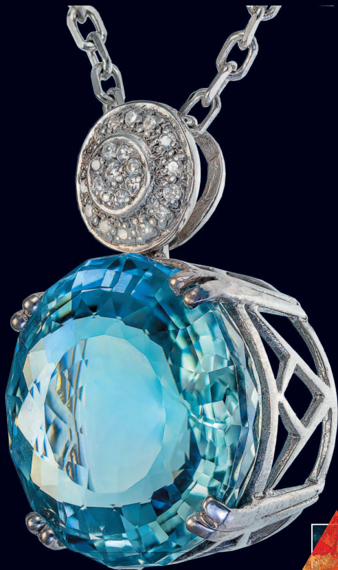
Подвеска с акваарином