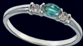
Кольцо с александритом и двумя бриллиантами