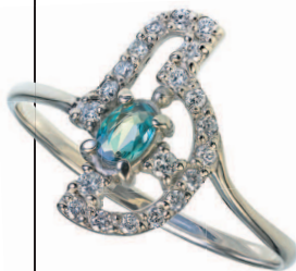
Кольцо с александритом и бриллиантами