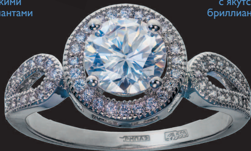
Кольцо с якутскими бриллиантами