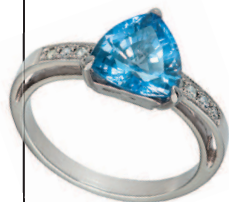
Кольцо с аквамарином