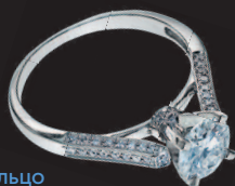
Кольцо с якутскими бриллиантами

Власть концерна «Де Бирс» на алмазном рынке была абсолютной вплоть до начала XXI века. В настоящее время Де Бирс потеряли монополию и алмазным бизнесом занимаются компании из многих стран, в частности из России, Австралии и Канады.