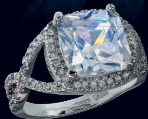
Кольцо с бриллиантами. Центральный камень 4.42 карата