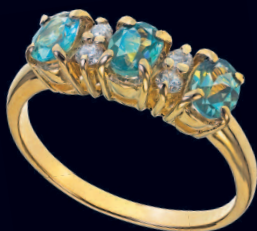
Кольцо с александритами и бриллиантами