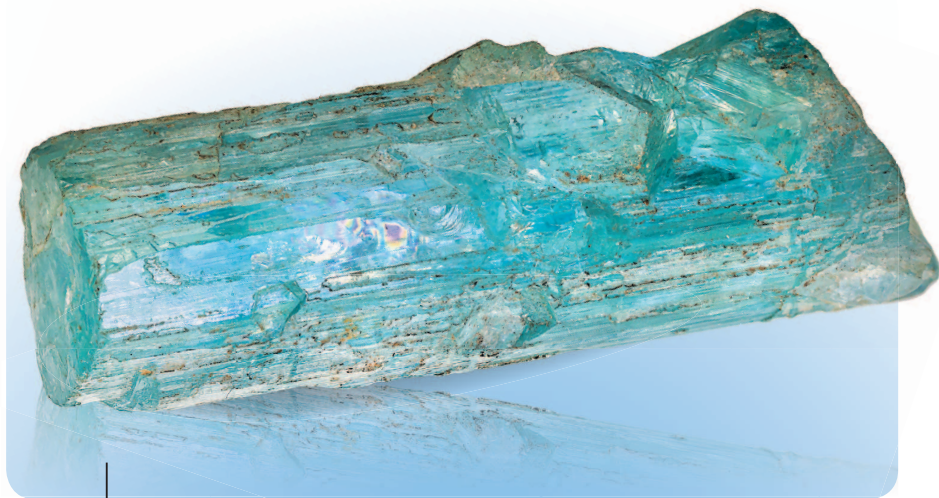
Кристалл неограненного аквамарина. Забайкалье