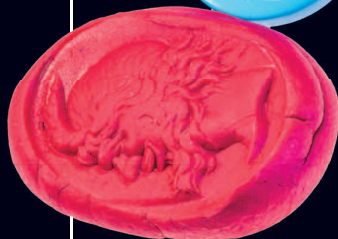
Инталио из аквамарина с изображением древнегреческого бога дикой природы и плодородия Пана