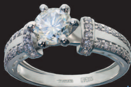
Кольцо с якутскими бриллиантами