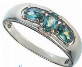
Кольцо с шри-ланкийскими александритами

Исключительная редкость и чисто русское происхождение сделали этот редкий минерал обязательным украшением любой ювелирной коллекции в высшем свете царской России. Носить александрит полагалось в обрамлении двух бриллиантов, подчеркивая благие деяния царя Александра II: отмену крепостного права и реформу судебной системы. В настоящее время ювелирный этикет предписывает носить украшения с александритом в составе гарнитура: одиночное изделие с александритом надевать не рекомендуется.