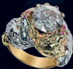
Кольцо с бриллиантом 4.06 карата