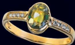
Кольцо с бразильским александритом и бриллиантами