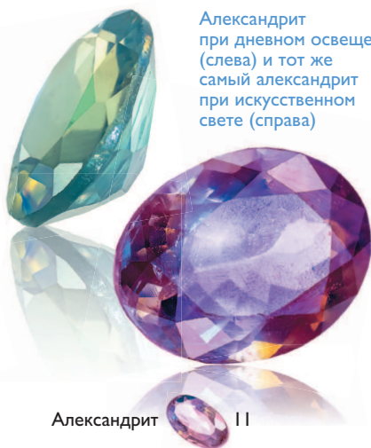
Александрит при дневном освещении (слева) и тот же самый александрит при искусственном свете (справа)