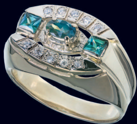
Кольцо с александритами и бриллиантами