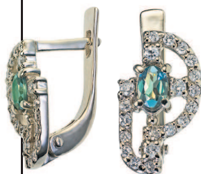
Серьги с александритами и бриллиантами