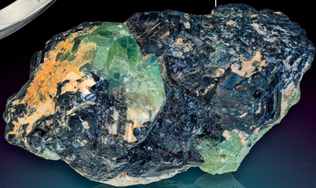
Александрит в породе