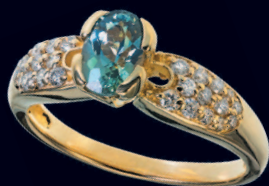
Кольцо с александритом и бриллиантами

В высшем свете царской России носить александрит полагалось в обрамлении двух бриллиантов, подерживая благие деяния царя Александра II: отмену крепостного права и реформу судебной системы.