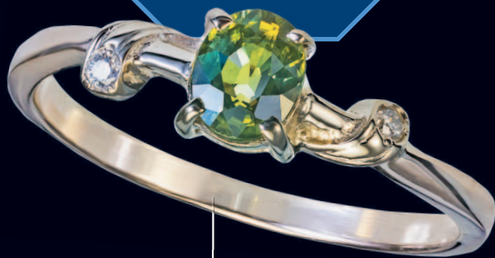
Кольцо с александритом и двумя бриллиантами