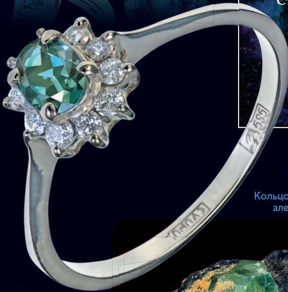
Кольцо с русскими александритом

Многие литотерапевты считают, что александрит способствует улучшению концентрации и усиливает способность к обучению.