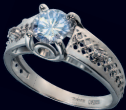
Кольцо с бриллиантами. Центральный камень 2.09 карата