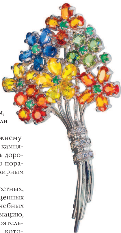
Брошь с фантазийными сапфирами

Эта книга будет интересна самому широкому кругу людей. Продвинутый коллекционер ювелирных изделий получит в руки краткий справочник, написанный геммологом GIA (Геммологического Института Америки), человек, покупающий в подарок ювелирное изделие, сможет правильно выбрать нужное украшение, счастливая обладательница драгоценного камня или ювелирного украшения сможет почерпнуть о нем больше любопытной информации. Те, кто впервые обратил свое внимание на прекрасный и удивительный мир драгоценных камней, смогут быстро и самостоятельно разобраться в ценах на ювелирные изделия, получив максимальное удовольствие от грамотно сделанной покупки, при этом не переплатив за нее лишних денег.