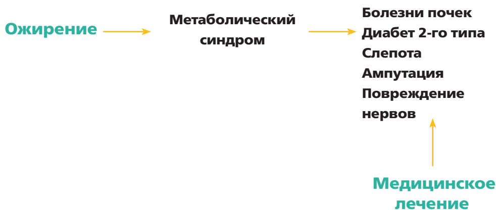
Рис. 1. Стандартная парадигма лечения

Корневой причиной проблемы был лишний вес. Ожирение вызывало метаболический синдром и диабет 2-го типа, а это вело ко всем другим