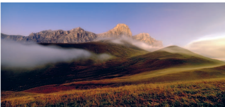
Закат в горах Чегема