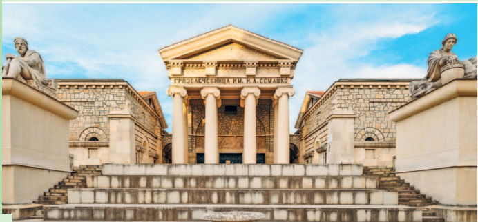
Грязелечебница им. Семашко Н. А.