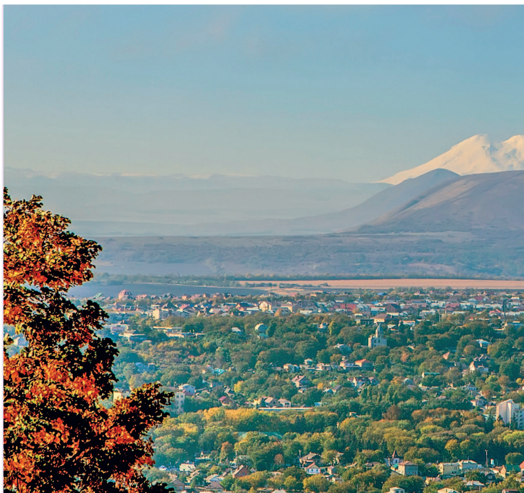
Вид на Эльбрус

бразной сытной кухней, которая понравится так сильно, что после возвращения в родной город вы будете искать рестораны с кавказскими блюдами и кавказскими поварами. Цены региона порадуют любого путешественника, и поездка выйдет довольно дешевой, зато впечатления останутся в памяти навсегда. Альпийские луга с пасущимися на них барашками