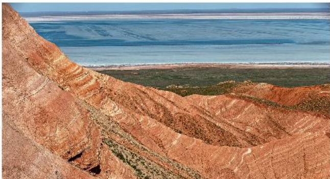
Гора Большое Богдо

До каспийских пляжей, однако, вы не доберетесь: побережья как такового нет, бесконечные тростниковые заросли переходят в поросшее рдестом и злодей мелководье. Но вы сможете отлично провести время на одной из сотен баз отдыха, а заручившись компанией местного егеря, насладитесь охотой или лучшей в стране рыбалкой.