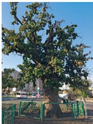
450-летний дуб рядом с ж.-д. вокзалом

Дорога на Атырау поддерживается в хорошем состоянии на российском участке, но крайне плоха в Казахстане.