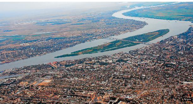
Астрахань Вид с вертолета

Недорогая гостиница в центре города между Кремлем и рынком Большие Исады. До Кремля – 15 мин пешком.