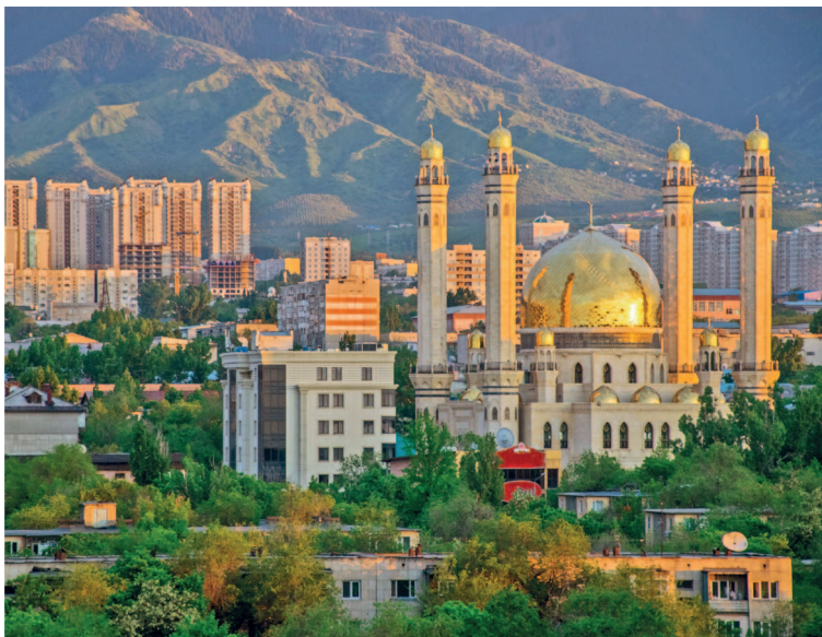
Вид на мечеть в Алматы

Вечер. Снимите накопленную за день усталость в новейшем аквапарке MIAMI Aquapark & SPA с разнообразными бассейнами, саунами, массажными и косметическими кабинетами (стр. 47). Поужинайте в кафе при аквапарке или отправляйтесь в ресторан «У Афанасьича» с хорошей кухней и вменяемыми ценами (стр. 45).