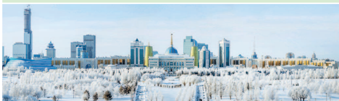
Зимняя панорама Нур-Султана