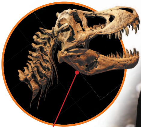
Окаменевший череп динозавра — тираннозавр рекс.

Одноклеточные организмы появились порядка четырех миллиардов лет назад. Губки — первые животные — возникли около миллиарда лет назад. С течением времени появились и распространились и более сложно устроенные животные. 165 млн лет назад началось господство динозавров; они вымерли 65 млн лет назад.