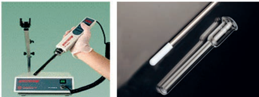
Рис. 1.1. Механический гомогенизатор тканей и стеклянный гомогенизатор с тефлоновым пестиком

Разрушение тканей осуществляется методом гомогенизации. Для этого применяются различные технические средства: ножевые гомогенизаторы, стеклянные гомогенизаторы с тефлоновым или стеклянным пестиком. Выбор прибора зависит от консистенции ткани и необходимой степени ее измельчения (рис. 1.1).