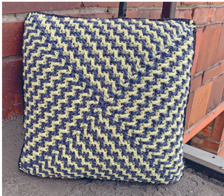
Подушка «Вихрь», техника центральной мозаики

Про одежду: знаю, что у вас точно возникнет вопрос, почему при вязании мозаики я ограничилась только предметами интерьера и декора. Мозаичное вязание способствует тому, что плотное крючковое полотно становится еще плотнее, поэтому для вязания вещей оно не подходит. Хотя если взять пряжу и крючок потоньше, то можно справиться с плотностью. Но здесь вступает в дело моя лень — все же одежда требует детальных расчетов. Единственное, что я с легкостью связала в мозаичной технике, — это круговой снуд, его описание вы найдете в разделе «Практикум». Но я буду рада увидеть ваши свитера в этой технике!