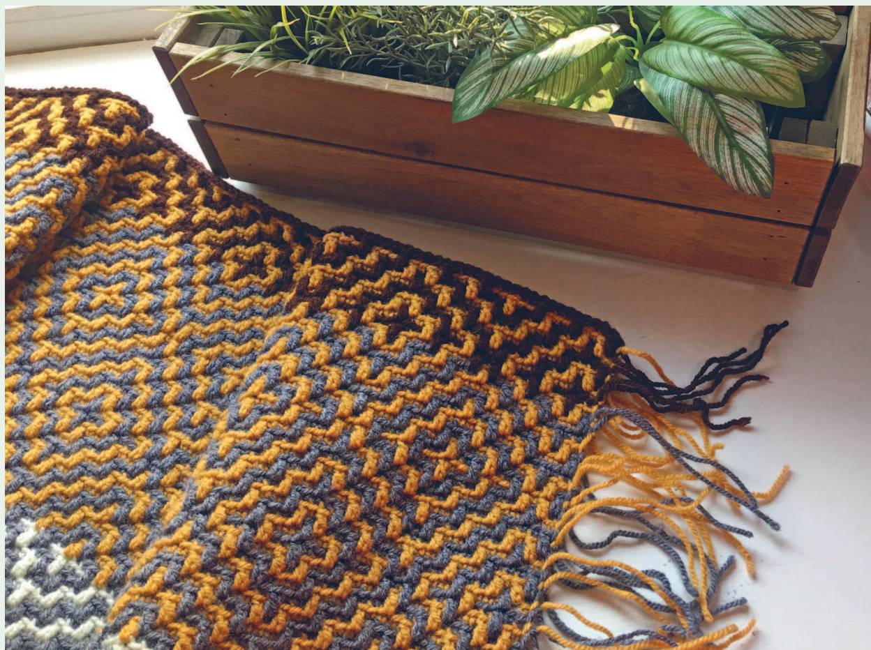
«Самый нескучный в мире плед», техника прямой мозаики

В книге вы найдете фотографии моих изделий и работы учеников, которые на протяжении двух лет вязали вместе со мной мозаичные пледы и подушки. Вы сможете на конкретных примерах посмотреть, как те или иные орнаменты играют в полотне, как можно работать с цветом и фактурой. Я еще раз сердечно благодарю всех, кто предоставил мне свои фотографии, — спасибо вам за поддержку и доверие.