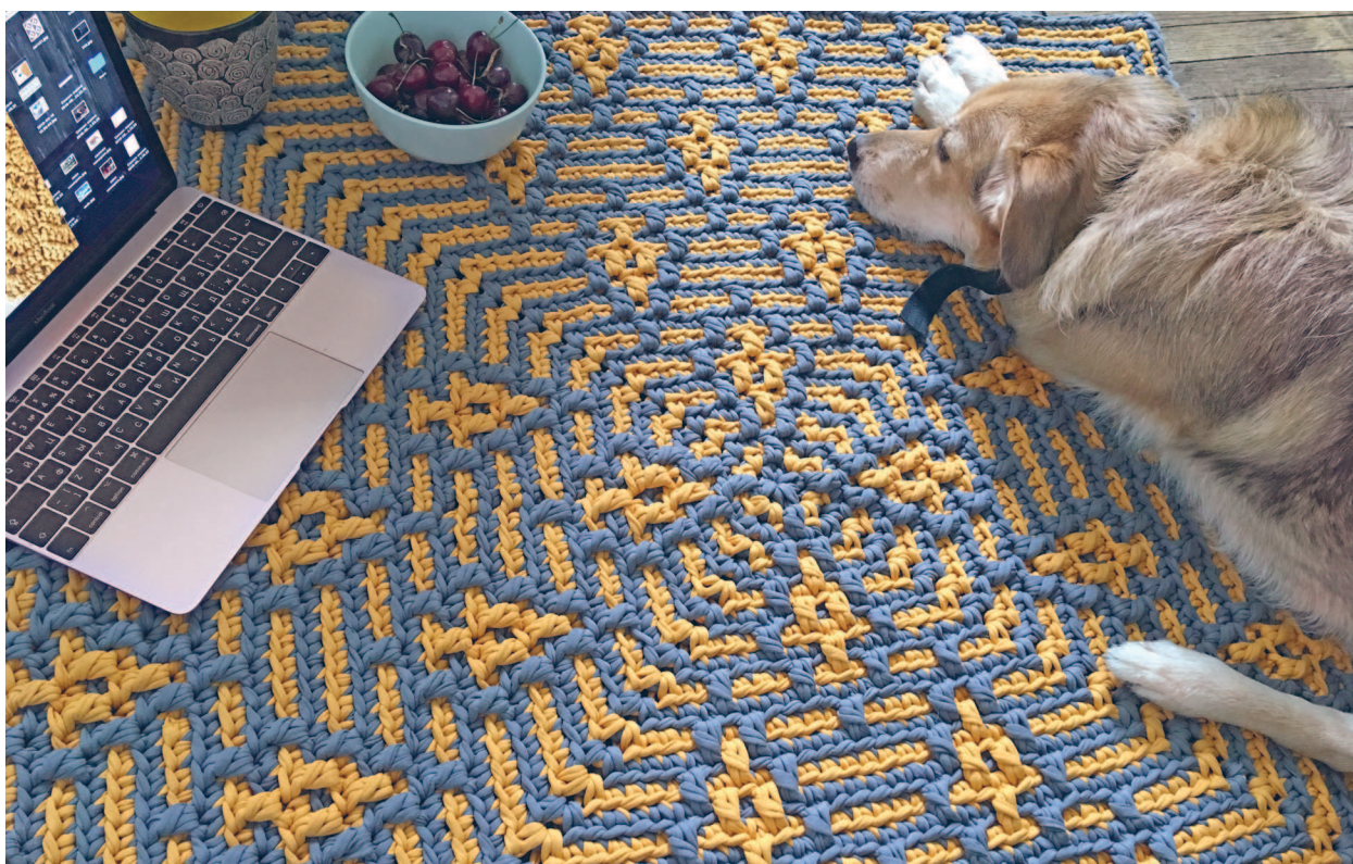
Ковер «Невишневый лес» связан из трикотажной пряжи крючком № 10

Помимо пряжи и крючка вам понадобятся удобные острые ножницы и хорошее настроение!