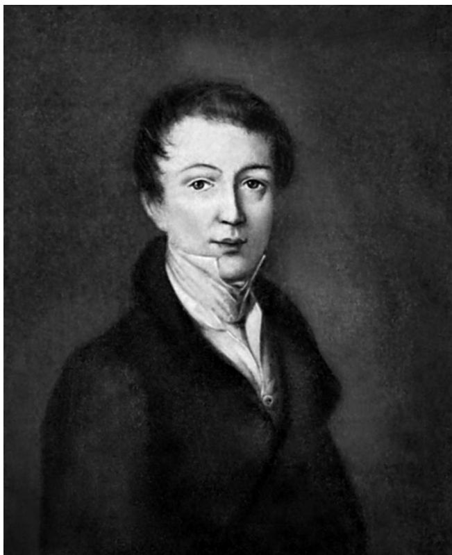
Ф. И. Тютчев. Портрет маслом работы неизвестного художника. Начало 1820-х годов.