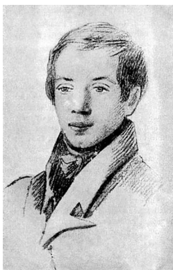
М. П. Погодин.

Рисунок неизвестного художника. Москва, 1820-е годы.