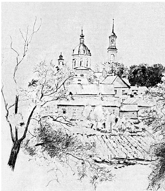
Овстуг — родовое имение Тютчевых. Вид из окна. Рисунок сделан с натуры другом Тютчева поэтом Яковом Полонским.