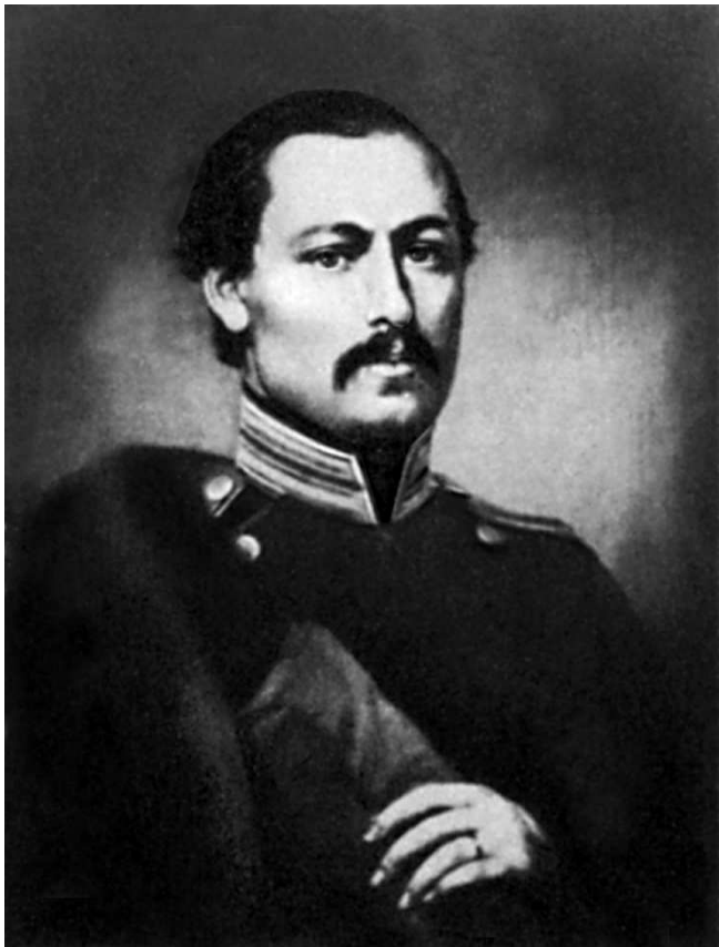
А. А. Фет. Портрет работы неизвестного художника. 1840-е гг.