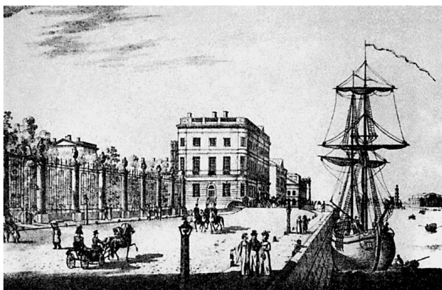
Летний сад. 1820-е годы. Издание А. Плюшара