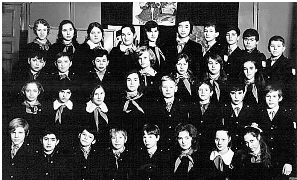
▲ В школе.

Решила: выйду замуж, а если не понравится, разведусь. При нашей первой встрече Роберт был с гитарой — так она и вошла в наш дом 2 .