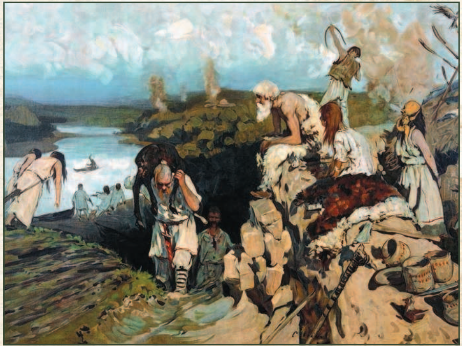
Жилье восточных славян. С работы С. В. Иванова.

В I тысячелетии и позднее земледелие было подсечно-огневым. Люди вырубали и выжигали леса (или выжигали травы и кустарники в лесостепной и степной зоне), освобождая землю под пашню, где растили рожь, пшеницу, просо, ячмень. Через несколько лет переходили на другой участок, прежние поля использовали под пастбище, а потом оставляли землю свободной, позволяя вырасти новым кустарникам и деревьям. Быстрее всего росли березы. А именно березовый древесный уголь лучше всего подходит для печей, в которых варилось железо. Так земледелие развивалось одновременно с металлургией.