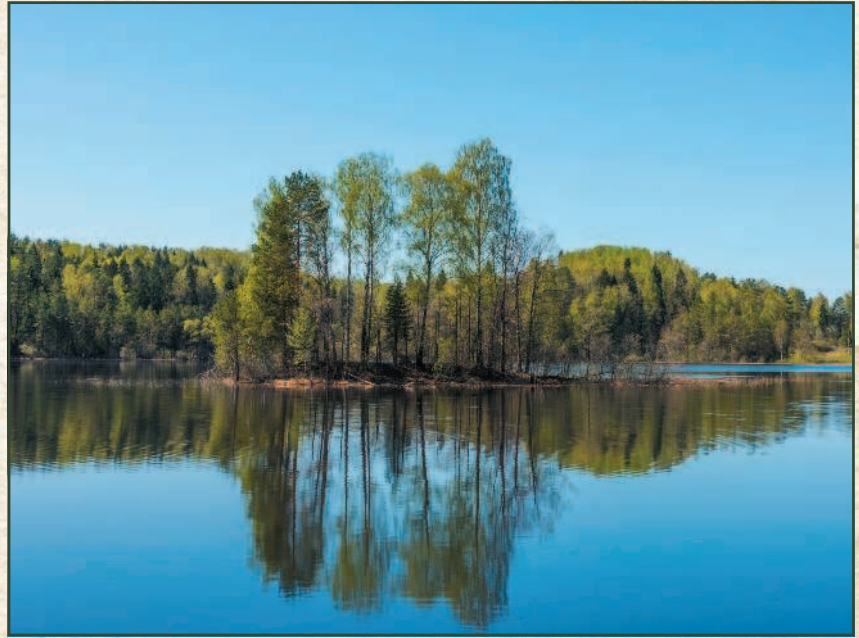
Озеро Сашио в Смоленской области. На его берегу найдены остатки поселений тушемлинской культуры железного века.

В VIII в. до н. э. — IV в. н. э. в верховьях Днепра и Западной Двины жили земледельческие племена днепро-двинской культуры. Племена занимали территории современных Псковской, Тверской и Смоленской областей России, а также Витебской и Могилевской областей Беларуси. Ее сменила тушемлинская культура. На территориях Калужской, Тульской и Орловской областей в IV—VII вв. существовала мощинская культура. Все эти племена железного века были балтами, но позднее их потомки смешались со славянами.