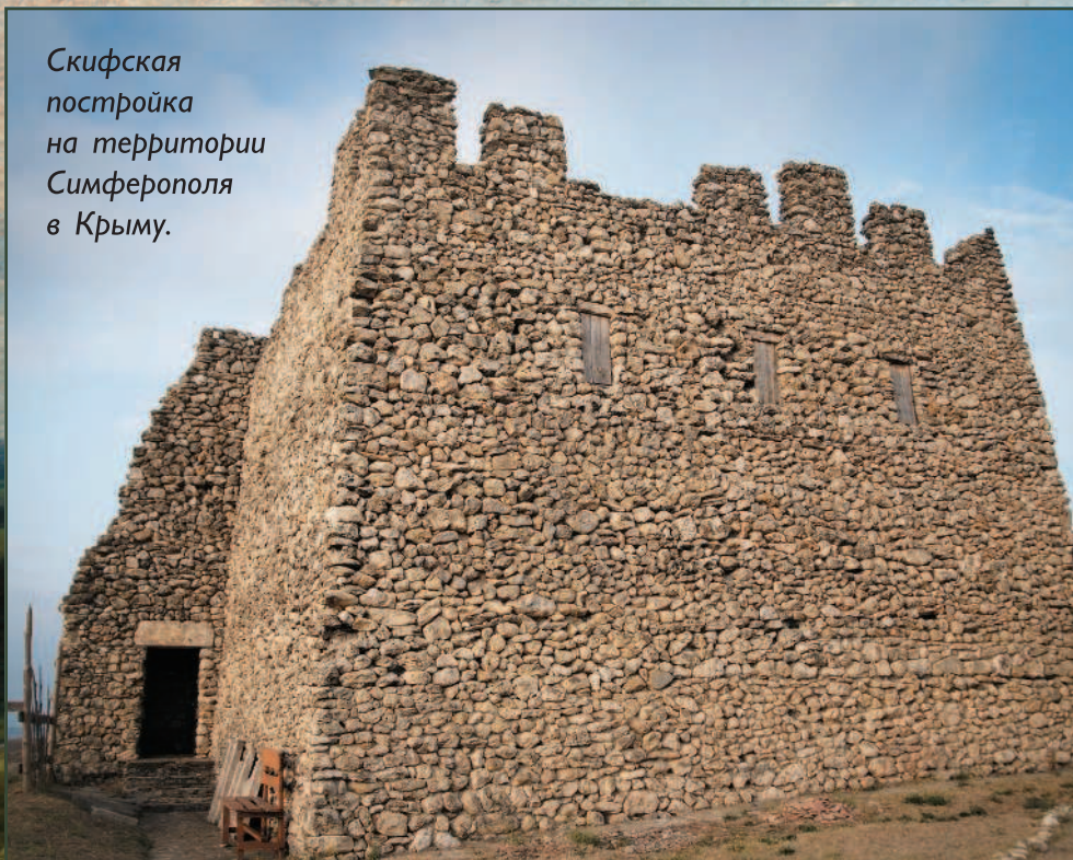
Скифская постройка на территории Симферополя в Крыму.

Россия — самая большая страна в мире, она простирается от Балтики до Берингова пролива и Тихого океана, от Алтая и Кавказа до полярной тундры и Северного Ледовитого океана. Как и в других областях нашей планеты, люди поселились здесь в глубокой древности и прошли путь от каменных топоров до железных мечей, от охоты до земледелия, от хижин до укрепленных городов, от первобытной общины до государства. Лесные охотники и степняки-скифы, готы и славяне, древнегреческие города на Черноморском побережье и первые славянские деревянные крепости на берегах рек — все это древняя история нашей Родины.