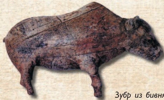
Зубр из бивня мамонта. Зарайская стоянка.

На юге Московской области, вблизи города Зарайска, археологи обнаружили остатки стоянки людей каменного века. Жили они примерно 15—23 тыс. лет назад и занимались охотой и собирательством. Здесь, возле границы льдов, медленно отступающих на север, древние люди охотились на зубров, оленей, зайцев и пушных зверей. Добывали и мамонтов — либо охотой, либо находили останки этих огромных зверей, погибших под обвалами и ледниками. Изготавливали кремневые ножи, костяные проколки для сшивания шкур, мотыги из бивней мамонта для копания земли.