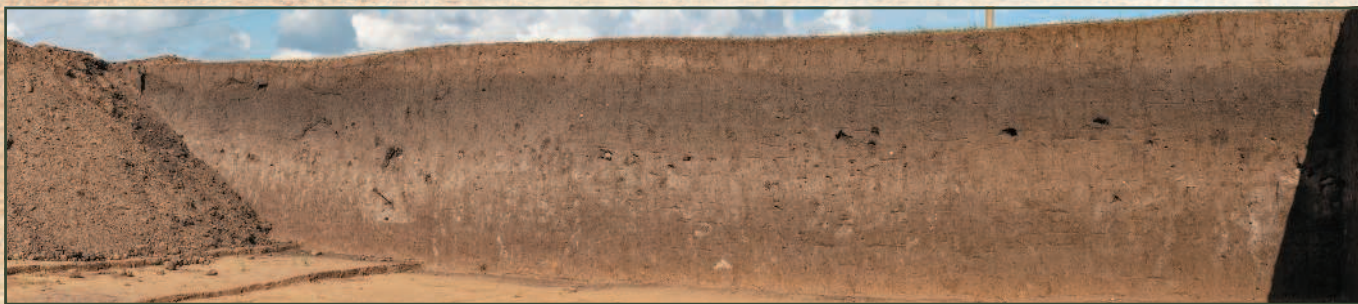
Культурный слой при раскопках скифского кургана.

В археологии важнейшее значение придается культурному слою. Это слой земли в местах, где жили или и сейчас живут люди, в котором содержатся остатки деятельности человека или его следы. Это может быть различный мусор, зола, мостовые, древние сооружения и многое другое. В каменном веке еще не было городов, поэтому мостовых и фундаментов в поселениях той эпохи, конечно, не находят, зато обнаруживают кости животных, остатки пыльцы древних растений, пищи, орудия труда.