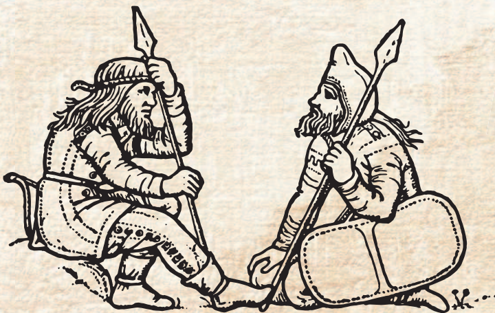
Скифские воины. Рисунок, сделанный по изображению на древнегреческой вазе.

С VIII в. до н. э. в Великой степи появились скифы — индоевропейский народ, родственник современным европейцам, индийцам, иранцам. В широком смысле Скифия — территория, простиравшаяся от Венгрии до Средней Азии. Великой Скифией древние греки называли Северное Причерноморье. Жизнь скифов, обитавших в Северном Причерноморье вплоть до реки Дон, описал древнегреческий историк Геродот, живший в V в. н. э., а их курганы, где захоронены скифские вожди, и сегодня являются частью степного ландшафта. Археологи находят в скифских курганах множество предметов искусства, быта, вооружения. Геродот разделял скифов на несколько племен: царские скифы, скифы-кочевники, скифы-пахари и скифы-земледельцы. Упоминает он и невров, и агафирсов, будинов и другие племена, жившие севернее, в лесостепи и лесах.