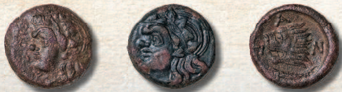
Монеты Боспорского царства.

На плодородной черноземной почве, которой и в наши дни славится Краснодарский край, боспорцы выращивали пшеницу, ячмень и просо. Урожаи были столь богатыми, что экспорт зерна стал основой экономики государства. Боспорский хлеб шел в Афины и другие города античной Эллады.