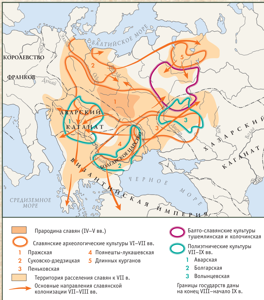
Расселение славян в IV—VII вв.