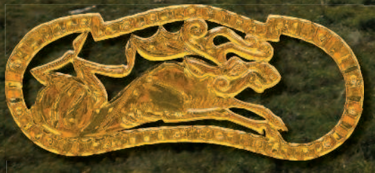
Скифское золотое украшение.