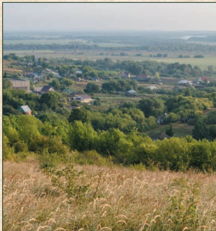
Вид на современное село Костёнки.

В Воронежской области, на правом берегу Дона, есть село Костёнки. В каменном веке в его окрестностях существовало около 60 поселений, они сменяли друг друга в течение 30 тыс. лет. Возраст самых древних оценивается в 45 тыс. лет, хотя встречаются и более ранние слои. Первыми жителями этих поселений были неандертальцы, но потом пришли люди современного типа — кроманьонцы. Сегодня эти места — лесостепь с плодородными черноземными почвами и развитым сельским хозяйством, а в древности здесь была приледниковая тундра, где люди охотились на мамонтов и строили из их костей жилища. Они были искусными мастерами, знали различные натуральные краски, делали фигурки из дерева и кости. Сегодня некоторые историки считают, что окрестности Костёнок — прародина всех европейских народов.