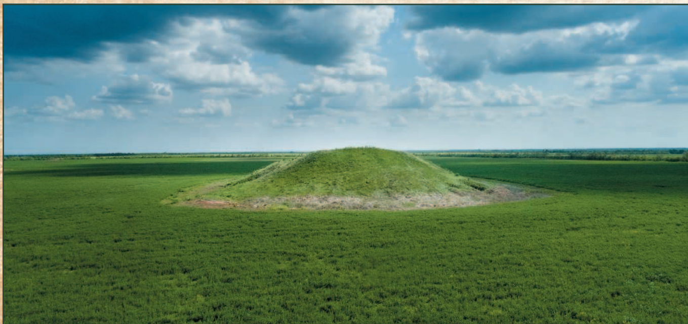
Скифский курган в степи.

Великая (Евразийская) степь простирается от Венгрии до Дальнего Востока. Веками она служила местом контактов Востока и Запада, в ее пределах расположены многие государства, в том числе Россия, история которой связана с этим обширным регионом самым тесным образом.