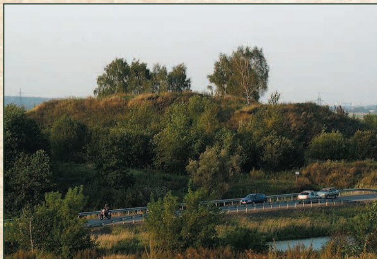
Щербинское городище в Домодедово.

Многие холмы, которые можно видеть по всей стране, — древние городища, например Щербинское городище в подмосковном Домодедово. Оно принадлежит к дьяковской культуре, названной по селу Дьяково, ныне входящему в состав Москвы. Культура существовала в VIII в. до н. э. — V в. н. э. на территории Московской, Ярославской, Вологодской, Смоленской, Тверской, Владимирской, Ивановской, Костромской областей. Представляли ее финно-угорские племена. Они обрабатывали землю у берегов рек, разводили лошадей, добывали пушного зверя.