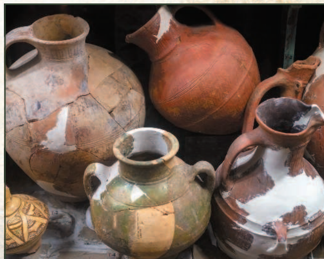
Античная керамика, найденная при раскопках древнего города Танаис.

Археологический комплекс «Танаис» на территории одноименного античного города.