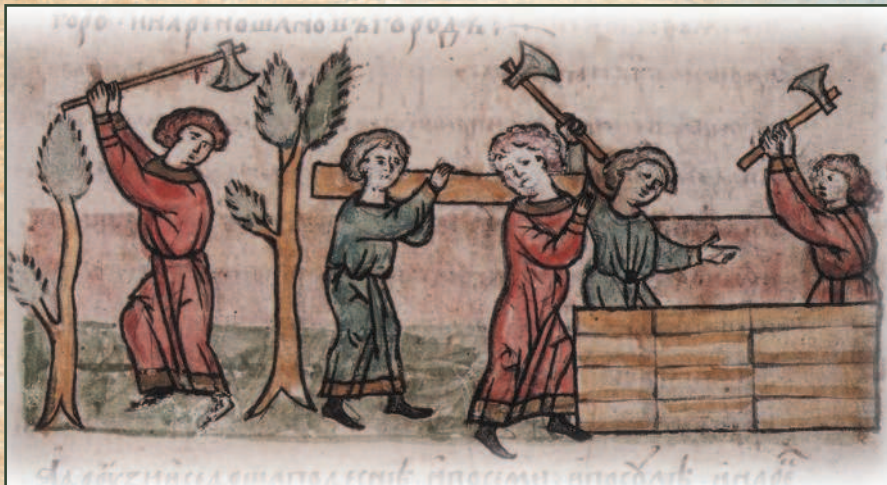
Построение Новгорода ильменскими словенами. 862 г. Радзивилловская летопись. XV в.

Самые старые города восточных славян — Ладога (сегодня село Старая Ладога), Великий Новгород, Псков, Белоозеро (совр. Белозерск), Изборск, Смоленск, Киев. Для города выбирали место, удобное для обороны, — на высоком берегу реки или озера, или же на высоком холме. При строительстве использовали главным образом дубовые бревна. Между двумя рядами частокола укладывали землю. Таких городов было много; недаром варяги — пришельцы с севера — прозвали Русь «Гардарикой» — страной городов.