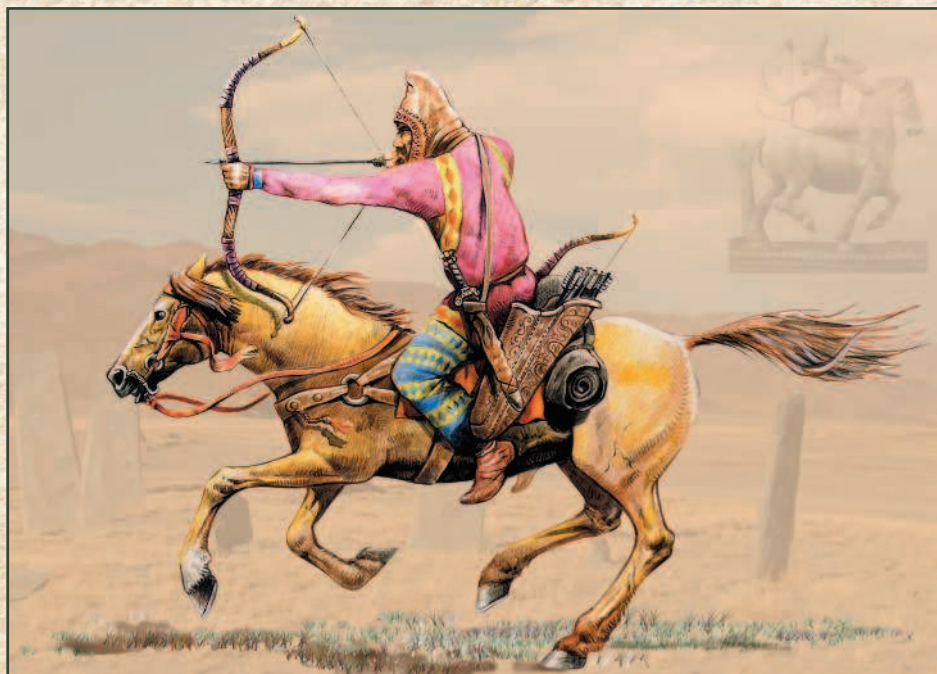
Скифские всадники, в отличие от их современников — греческих и римских воинов, пользовались седлами, что давало им преимущество в конном бою.

с Боспорским царством начались столкновения. Во II в. до н. э. скифы создали царство в Крыму, которое просуществовало до III в. н. э.