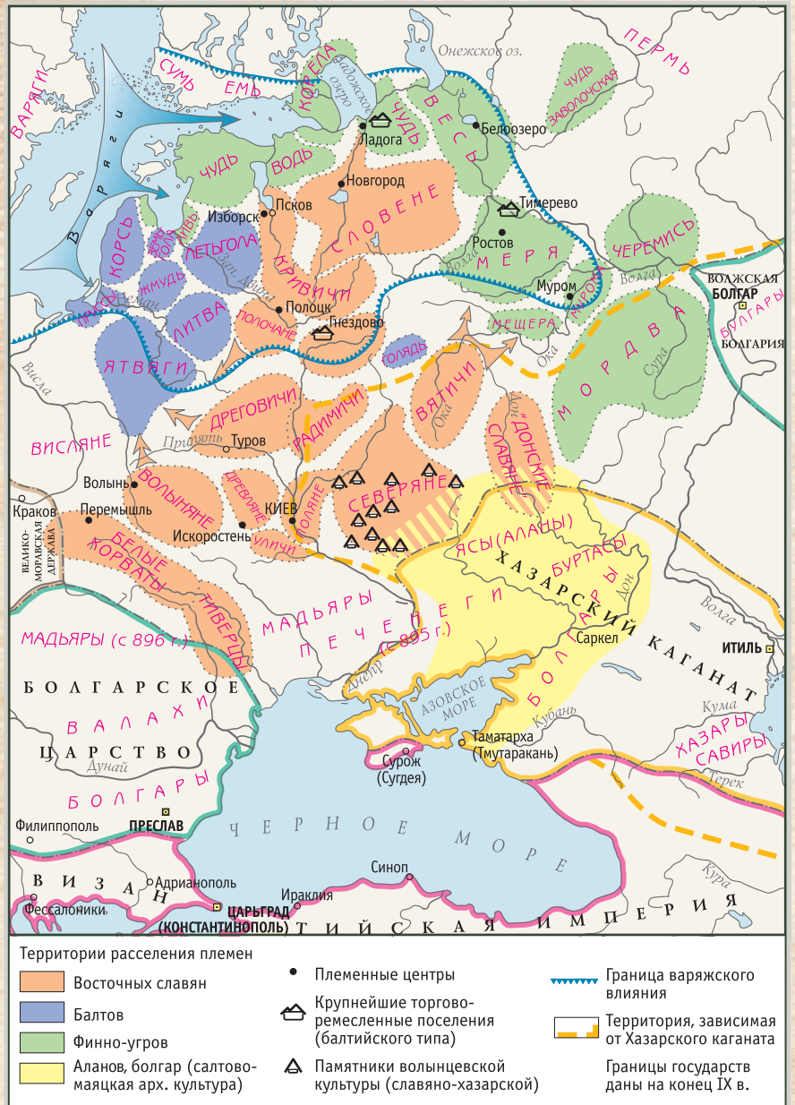
Древние славяне и соседние племена VIII—IX вв.

Железо в Средневековье по большей части добывали из озерной и болотной руды. Сам металл получали в печах, которые назывались домницами. Домницу строили из камней и скрепляли их глиной. Топливом был древесный уголь. Во время работы в такую печь все время нагнетали воздух с помощью мехов. В результате получалось так называемое кричное, губчатое железо. При дальнейшей обработке из него можно было получить сталь. Конструкция домницы позволяла получать и чугун, но его стали выплавлять на Руси несколько позже. А пока славянские мастера-кузнецы ковали мечи, топоры, делали наконечники для стрел, а также сошники — наконечники к деревянной сохе.