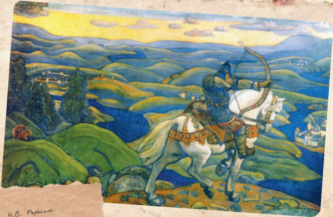
Н.В. Перина. Илья Муромец. Декоративное панно. 1910

Наверное, ни одна сказочная тема не вызывает у современного человека такой ностальгии, как тема силы. В современном мире всё наоборот: ума предостаточно, а вот силы не хватает. Современный человек всё понимает, всё знает, а сделать ничего не может или не хочет. И самая частая присказка: «сил нет». Мы живем в уставшем мире, бессильном мире, и не видно вокруг витязей и богатырей (и даже Терминатор стал всего лишь губернатором). Куда же всё делось? В чем тайна богатырской силы? На поиски ответов нужно отправляться на страницы сказок и легенд, туда, где бродят по свету и совершают свои славные подвиги могучие герои.