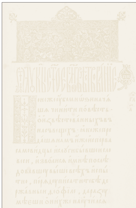
Начало Евангелия от Луки (напрестольное Евангелие сер. XVI века)

Между Евангелистами имеются некоторые разногласия: например, Матфей рассказывает об исцелении двух бесноватых (см.: Мф. 8, 28–34), а в параллельных повествованиях Марка и Луки говорится об исцелении одного бесноватого; свидетельства четырех евангелистов о посещении женами-мироносицами пустого гроба после воскресения Христа разнятся в деталях. Однако все эти и подобные разногласия объясняются тем, что об одних и тех же событиях писали разные люди, из которых одни были очевидцами событий, другие рассказывали