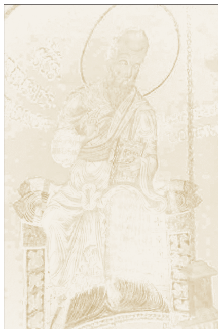
Апостолы Петр и Павел. Собор в Монреале, Сицилия, XII век

Христа Павел не был среди Его учеников, и после Его воскресения был активным противником и гонителем Церкви. Но обращение Павла, описанное в книге Деяний апостольских (см.: Деян. 9, 1–9), имело не меньшее значение для Церкви, чем Пятидесятница. Из гонителя Церкви Павел превратился в ревностного ее защитника и проповедника. Он совершил четыре миссионерских путешествия и закончил свой проповеднический подвиг мученической кончиной в Риме. Православная Церковь прославляет Павла как одного из двух, наряду с Петром, первоверховных апостолов.